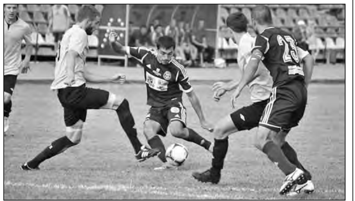
В зональном первенстве России среди любителей новокузнецкая команда (в темной форме) обыграла всех соперников, в том числе и прокопьевский «Шахтер» на его поле (2:1).

Табло Первенство России среди любителей клубов Зона «Сибирь». Высшая лига Итоговое положение команд: 1. «Кузбасс» (Новокузнецк) – 33 очка (разница забитых и пропущенных мячей: 24-2). 2. «Реставрация» (Красноярск) – 27 (33-8). 3. «Шахтер» (Прокопьевск) – 25 (30-9). 4. «Распадская» (Междуреченск) – 24 (23-9). 5. «Динамо» (Бийск) – 18 (20-21). 6. «Динамо» (Барнаул) – 15 (27-18). 7. «Селенга» (Улан-Удэ) – 15 (27-18). 8. «Сибирь-2М» (Новосибирск) – 15 (16-20). 9. «Полимер» (Барнаул) – 15 (14-18). 10. «Чита-М» (Чита) - 6 (12-33). 11. «Рассвет» (Красноярск) – 2 (8-41). 12. «Торпедо» (Рубцовск) – 1 (7-44).