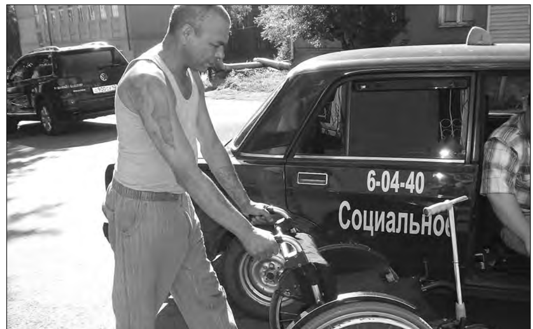
Водитель из Олиного таксопарка обязан был клиента-колясочника и пересадить на коляску, и на пятый этаж поднять.