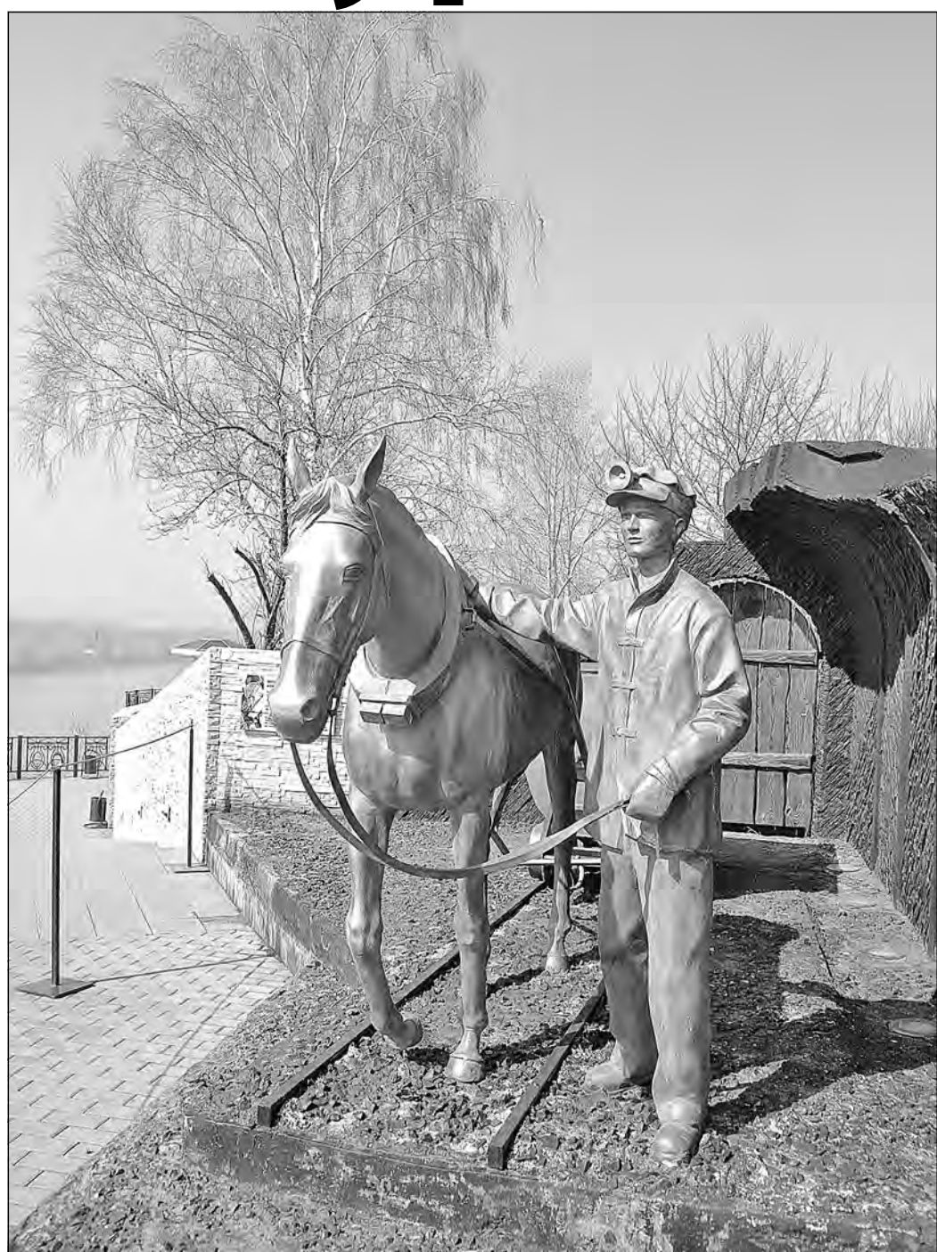
«Красная горка» ждет посетителей.