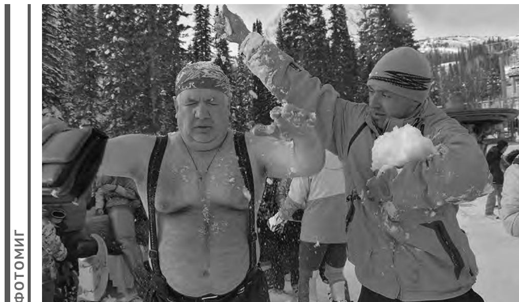
У горнолыжника голова тоже должна быть холодной...