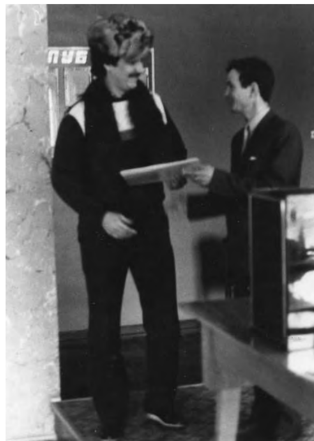
1986 год. Конкурс среди членов клуба. Лучший приз для победителя – пластинка.

Уважаемые женщины-матери! Искренне поздравляю вас с замечательным праздником душевного тепла и заботы – российским Днем матери! Сердечное спасибо и земной поклон за ваш святой материнский труд, за чуткость и понимание, за умение делать наш мир добрее и лучше. Пусть ваши дети растут счастливыми, талантливыми и любящими, а внуки дарят заботу и внимание! От всей души желаю вам тепла домашнего очага, здоровья и благополучия!