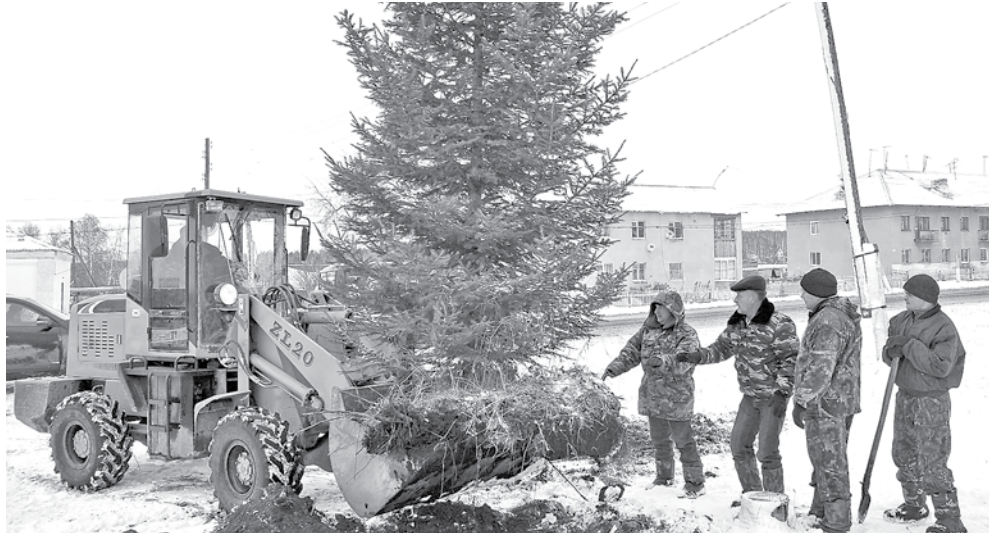
Из лесу елочку взяли... на всю деревню.