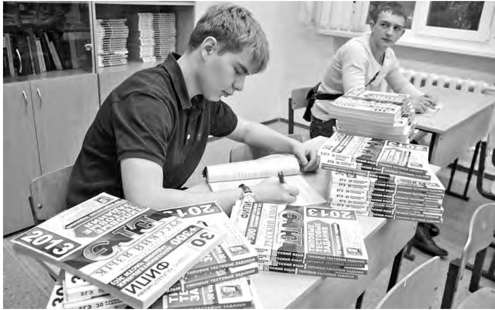
Нынешним ученикам выпускных классов не позавидуешь.

Чтобы понять это, мы проследили за тем, как сложились первые несколько месяцев в жизни ребят, получивших в этом году вместо вождленного аттестата о среднем образовании обидную справку.