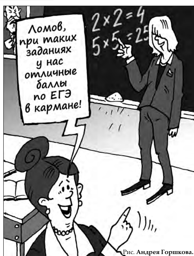
Рис. Андрея Горшкова.

В чем смысл таких новшеств? Некоторые специали-