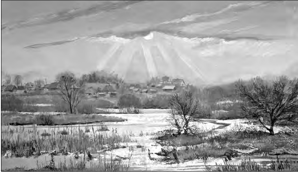
В. Кравчук. «Утренние лучи». 2009 г.