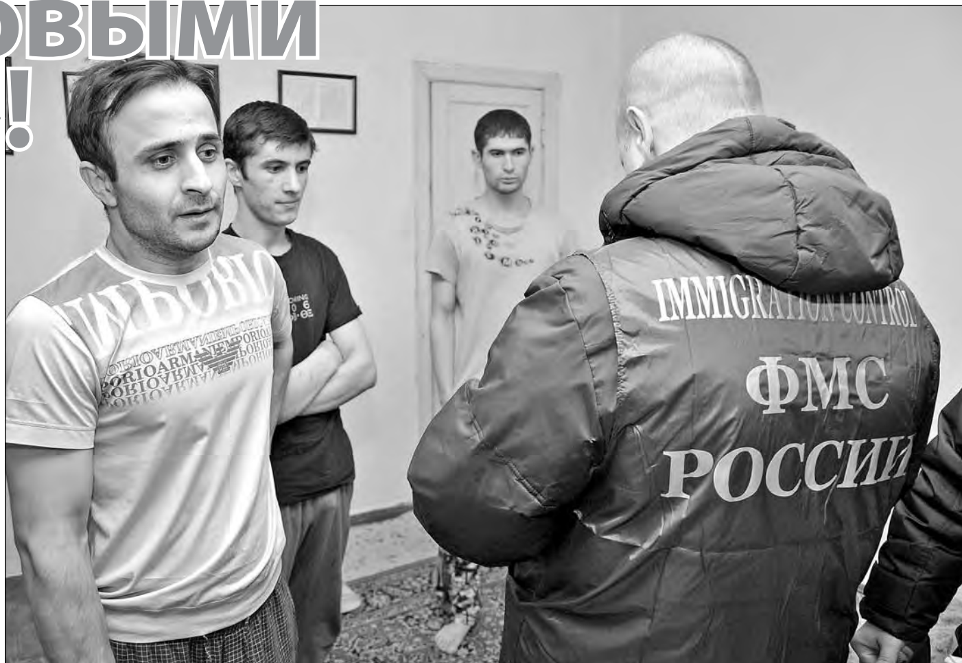
Предпримчивые собственники – естественно, во многих случаях небескорыстно – фиктивно регистрируют в «резиновых квартирах» не только нелегальных мигрантов, но и, например, находящихся в розыске преступников, а также тех, кто скрывается от кредиторов или уклоняется от армии.

Для Кузбасса эта ситуация не столь характерна, и за последний год число «резиновых квартир» у нас в регионе сократилось с двух с лишним десятков до двух – в Юрге и в Кемерове. В них прописаны 112 человек.