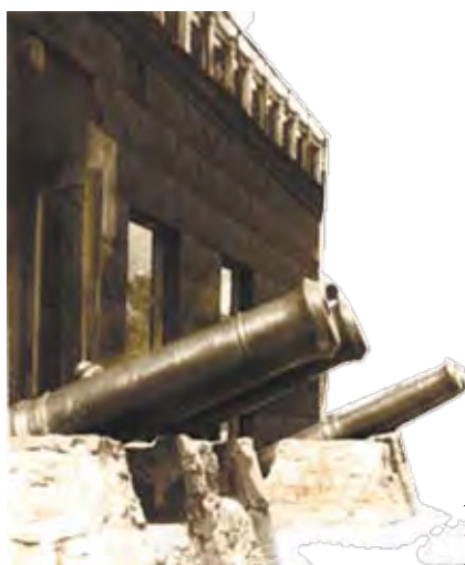
Новокузнецкий краеведческий музей.

В 1999 г. открыт филиал музея в бывшем здании Кузнецкого уездного училища – историко-архитек-