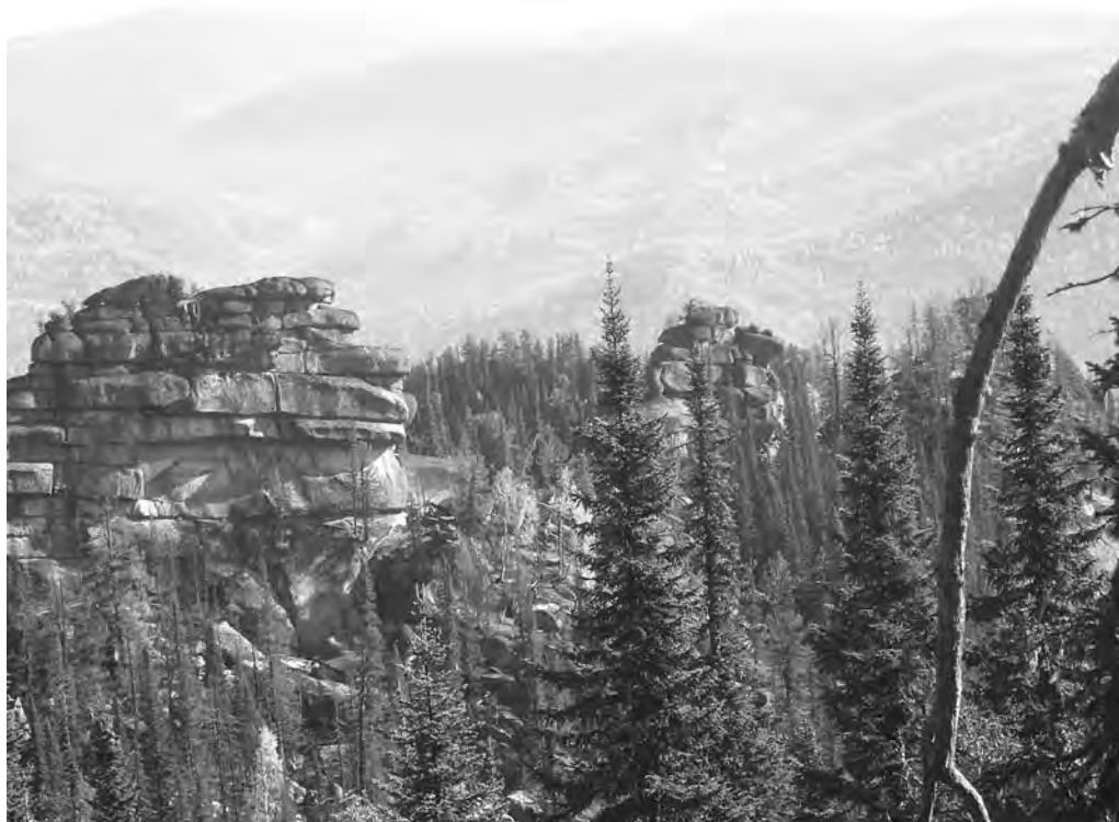
Та самая стена из гигантских гранитных кирпичей.