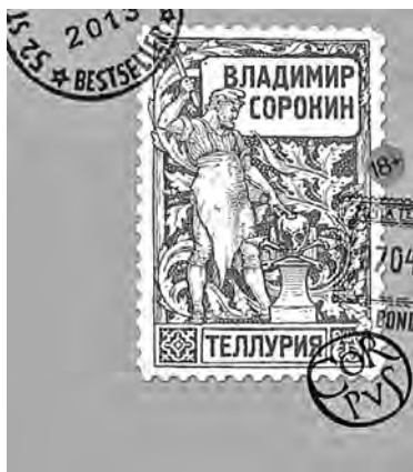
Владимир Сорокин. Теллурия. Роман. М.: АСТ, Corpus, 2013. 448 с.

Окрестности Теллурии нарезаны на феодальные лоскутки: из них состоит не только Россия, но и Европа, и Америка. Европа распалась в результате нашествия ваххабитов, которых, впрочем, остановили где-то под Марселем. Теперь в Рейнско-Вестфальской республике выбирают в канцлеры турка и чествуют националь-