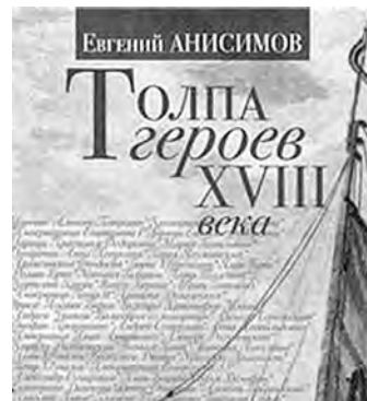
Евгений Анисимов. Толпа героев XVIII века. М.: Астрель, 2023. 668 с.

Иногда случаются и легкие передержки. Скажем, Иван Иванович Бецкой, сподвижник Екатерины II, если верить автору, – чудесный, прекрасноталантливый человек, блестяще образованный, романтик государственной службы, воспитательные дома в России завел. И только мельком, почти между строк, говорится, что