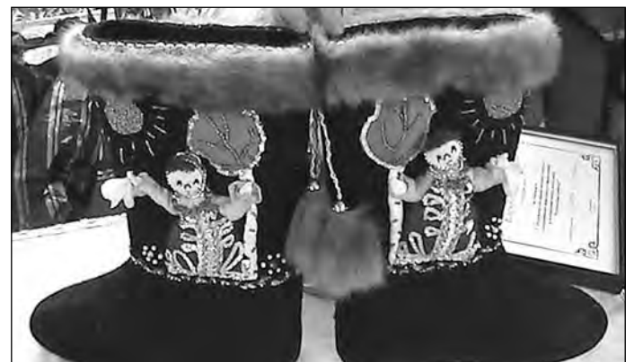
Вот эти валенки Елена Широковская вышила для невесты с Кавказа.