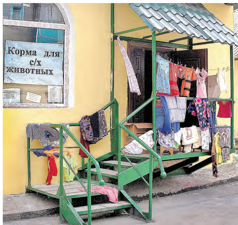
Ассортимент шире некуда.