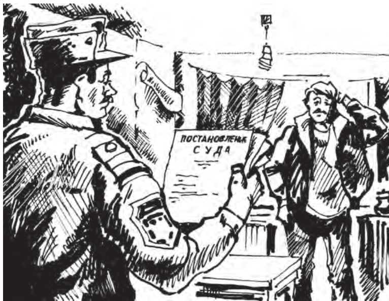
Рисунок Андрея Горшкова.