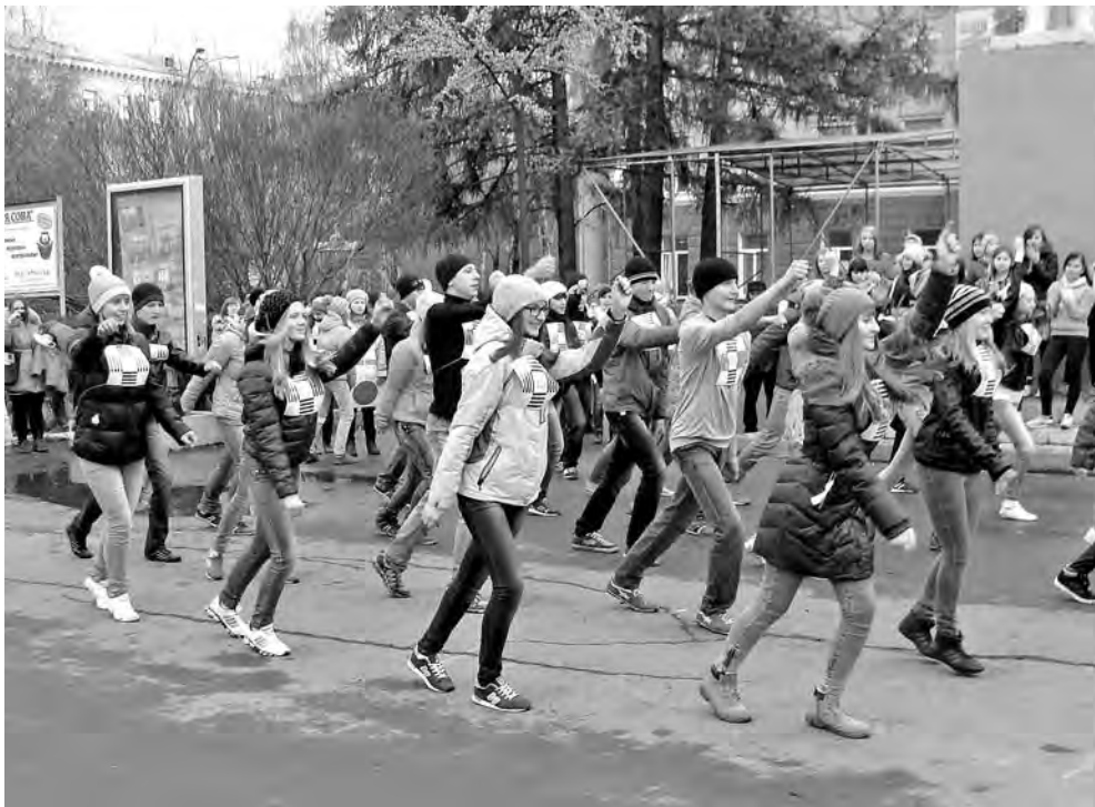
Школьники Кировского района провели танцевальный флешмоб «Мы вместе», посвященный дорожному движению.