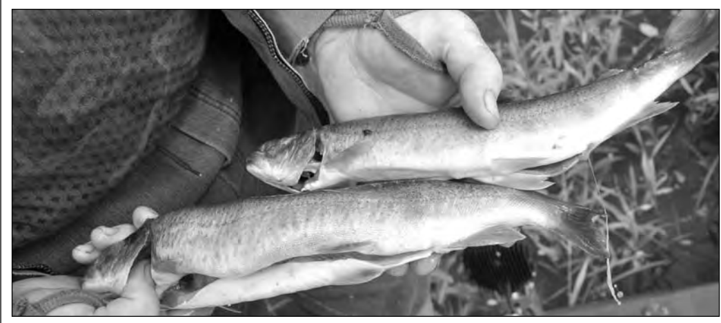
Улов из двух тайменшат «тянет» на уголовное дело.

Указанная позиция о правомерности действий государственных инспекторов также отражена в решении Кемеровского областного суда от 06.05.2013 по делу №21-199/2013».