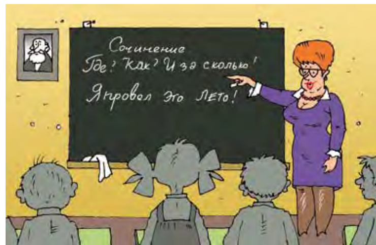
Рис. Андрей Горшкова.