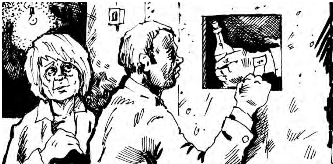
Рисунок Андрея Горшкова.

Подсудимая полностью признала свою вину, раскаялась, ее клиент не отравился – учитывая эти смягчающие обстоятельства, федеральный суд Центрального района Прокопьевска назначил гражданке наказание, с учетом неотбытого, 300