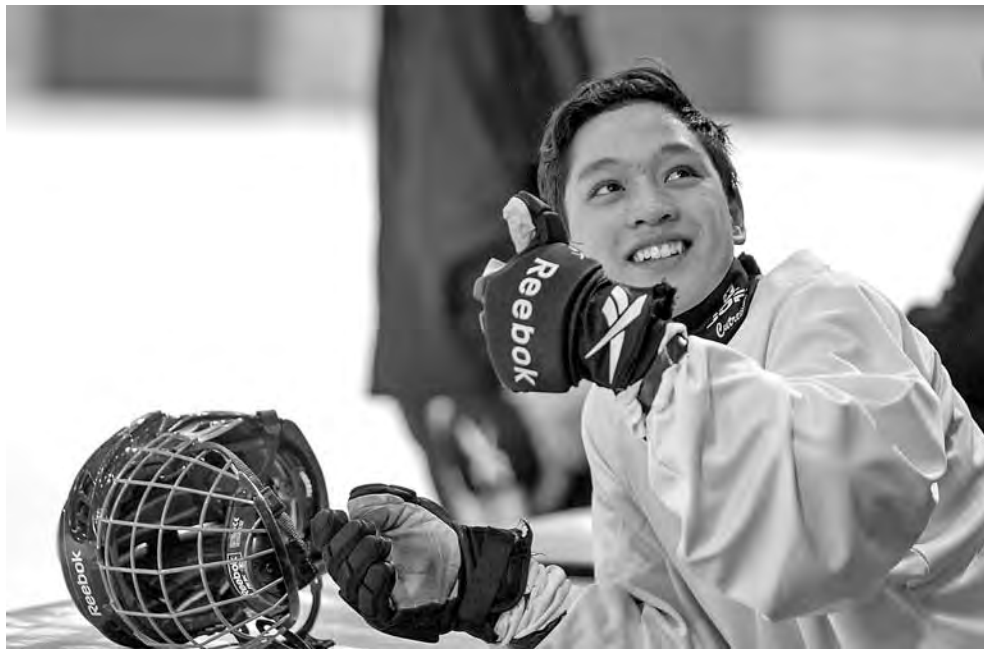
Йоллю все в Кемерово нравится!