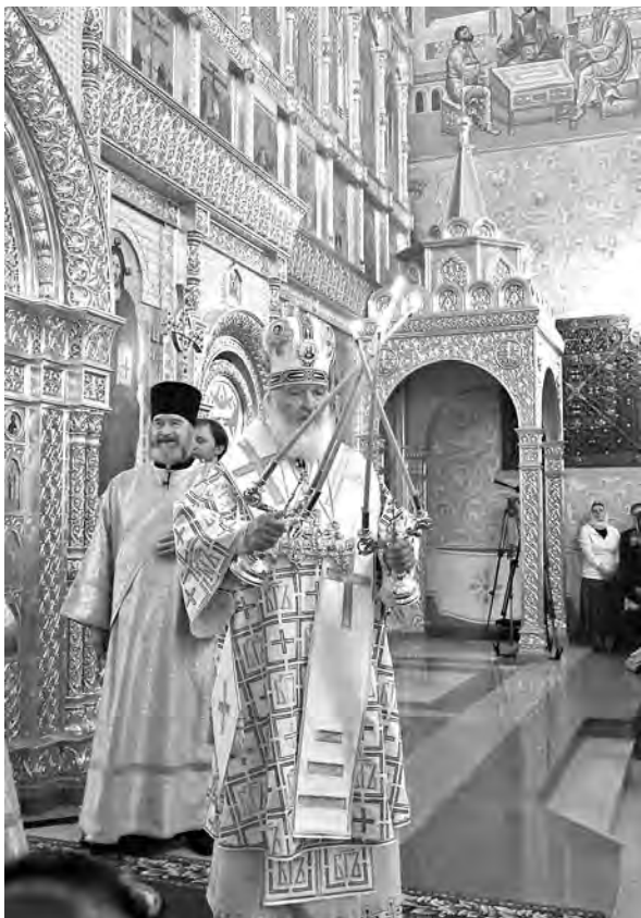
Патриарх освятил храм Рождества Христова в Новокузнецке.

P.S. Между прочим, на рынках и базарчиках полным-полно грибов продают. Но все они – летние. Опят еще нет, а значит, еще не осень.