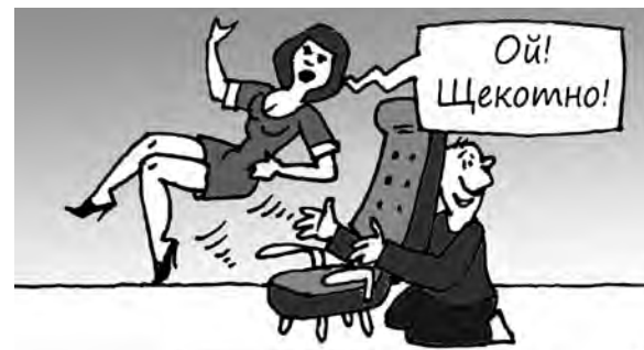
Рис. Андрея Горикова.