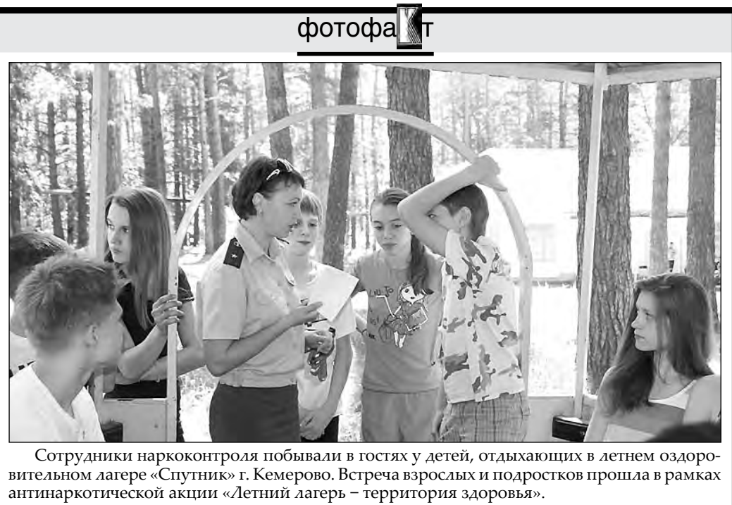
Сотрудники наркоконтроля побывали в гостях у детей, отдыхающих в летнем оздоровительном лагере «Спутник» г. Кемерово. Встреча взрослых и подростков прошла в рамках антинаркотической акции «Летний лагерь – территория здоровья».