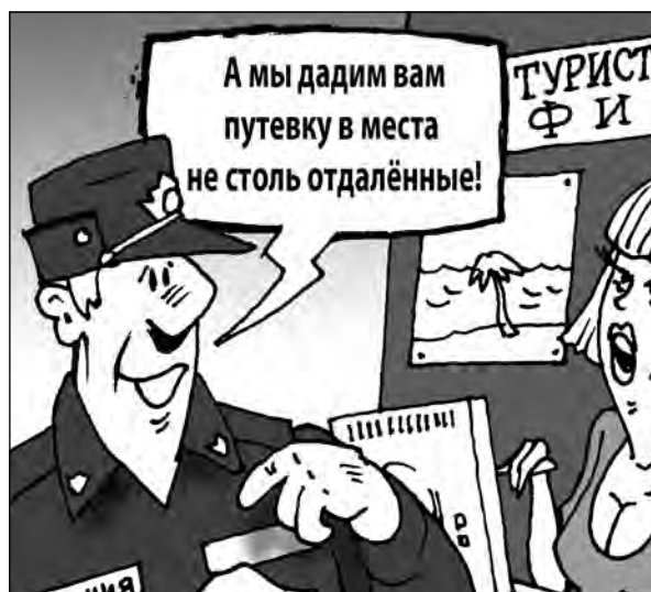
Рисунок Андрея Горшкова.

Как рассказал сотрудник пресс-службы ГУ МВД России по Кемеровской области Владимир Сергеев, в ходе расследования были проведены необходимые экспертизы, допрошены десятки свидетелей. В настоящее время директору турфирмы предъявлено обвинение, уголовное дело направлено в суд. За мошенничество в особо крупном размере ей может грозить до десяти лет лишения свободы.