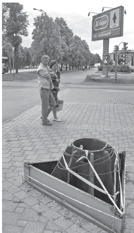
В Кемерове на одном пяточке можно увидеть и сохранившуюся «наружку», и демонтированную.

«Все мы понимали, что рано или поздно все закончится. Но ждали аукционов, а тут демонтаж всего и вся. Мы были готовы узаконить размещение конструкций по новым правилам. Но в ответ тишина», – сообщил в личной беседе руководитель одного из агентств. Что же до «намеков и неполной ин-