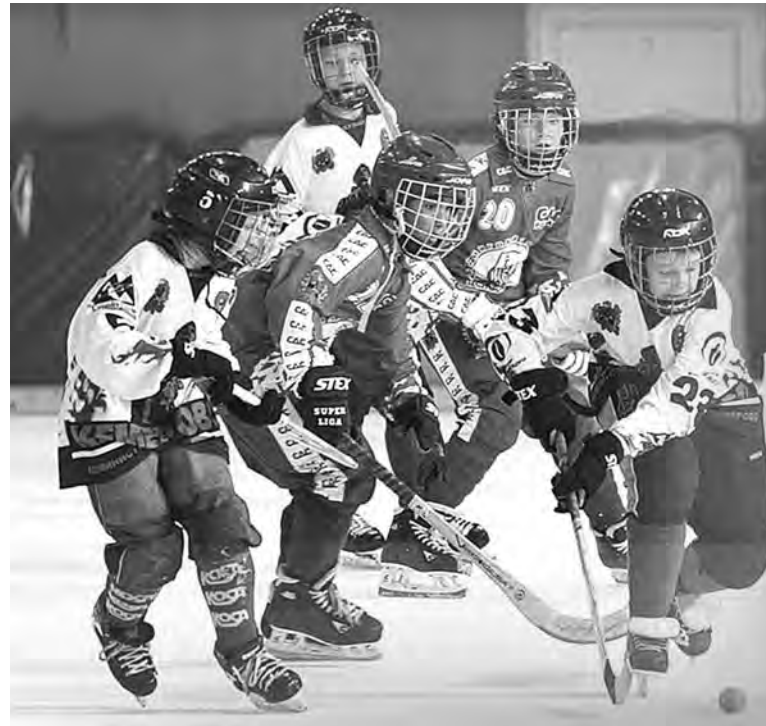
Сибирская детская лига - полноценная соревновательная школа для юных хоккеистов.

Весомый опыт организации соревнований позволяет нам сделать следующий шаг: в начале ноября этого года в Кемерове состоится первый в истории Кубок мира среди детей. Принимаем заявки команд на участие в турнире, который, уверен, пройдет на достойном уровне.