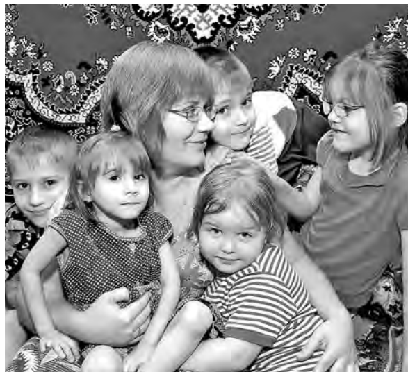
«Радость моя – дети».