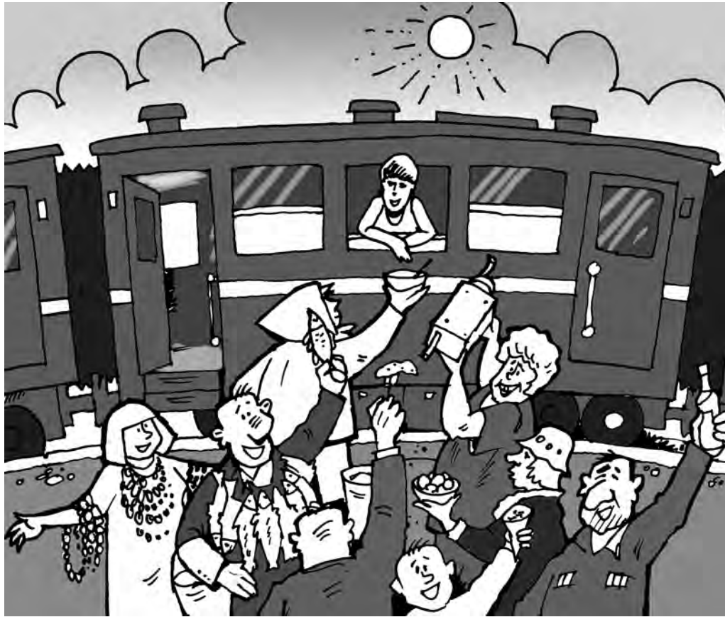
Рис. Андрея Горшкова.