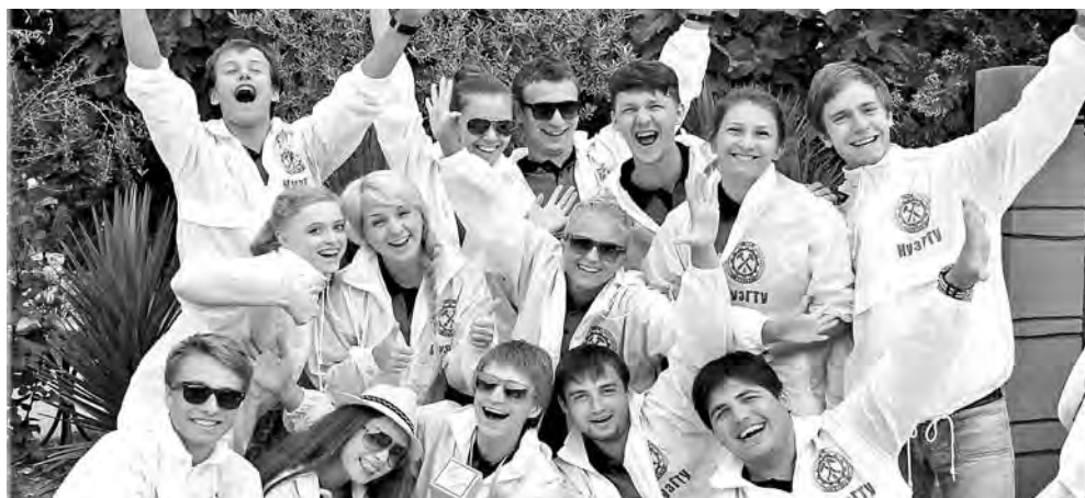
Театр «Карман» в нынешнем году удостоен главного приза международного театрального фестиваля.

за успехи в учебе и научной работе награждается медалью «Гордость университета». И хочется надеяться, что вуз воспитывает у молодежи такое ценнейшее качество, как оптимизм!».