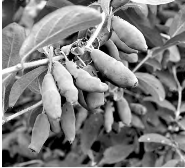
Спелая жимолость – первая ягода в саду.

ягод, надо позаботиться о том, чтобы и на следующий год жимолость активно плодоносила. Что для этого нужно сделать?