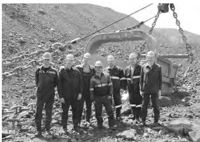
Участники конкурса «Лучший по профессии-2013»