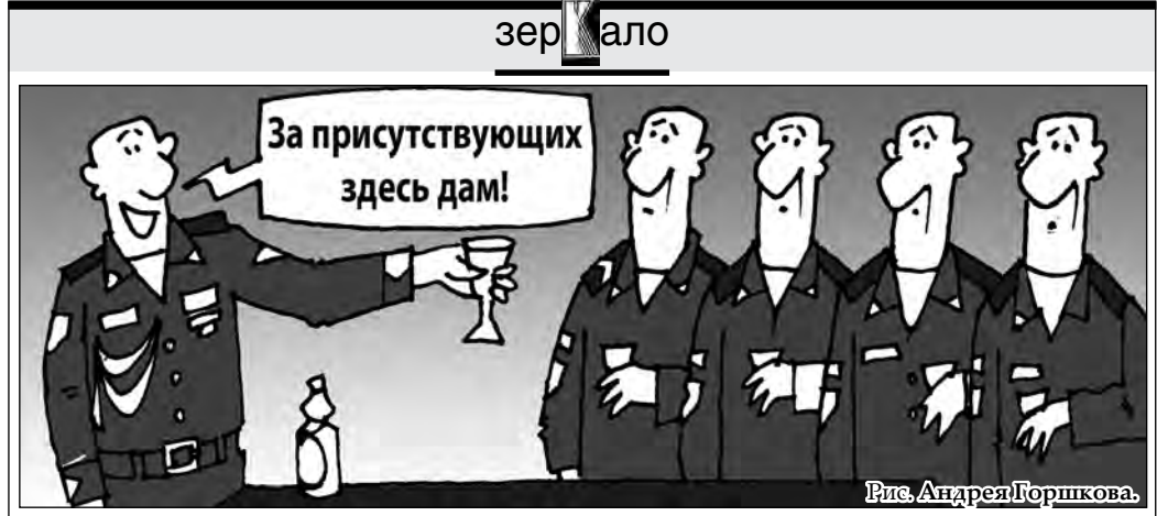
Рис. Андрей Горшков.

По горизонтали: 1. Собрание репродукций, фотографий, изданных в виде книги. 3. Угол между направлением компасной стрелки и направлением на данный предмет. 5. Советский поэт и писатель, отказавшийся от присужденной ему Нобелевской премии по литературе. 7. Музыкальный ударный инструмент. 8. Столица североамериканского государства. 9. Стреление земной коры. 10. Большой ящик с крышкой на петлях и замком. 11. Вексель на предъявителя. По вертикали: 1. Насекомое, известное как наездник и используемое для борьбы с гусеницами-вредителями. 2. Специальность ученого. 3. Переработка нефти. 4. Древнескандинавское название Руси. 5. Единственный приплот у суки. 6. Денежная единица в Замбии. 7. Платформа. 8. Табак. 9. Интонация. 10. Сундук. 11. Австрия. 12. Периодический элемент.