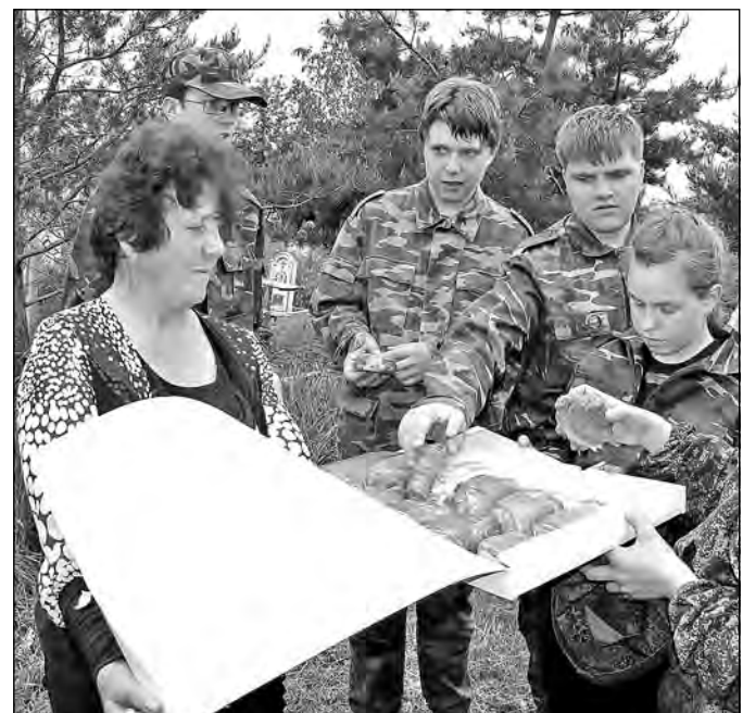
Семья Милыевых угостила пирогами поисковиков отряда «Подвиг» из Юрги — помяните солдата.