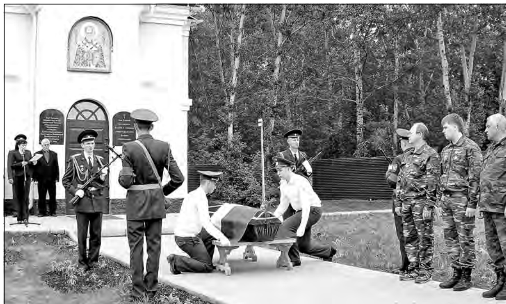
На траурном митинге совершается ритуал свертывания Государственного флага.