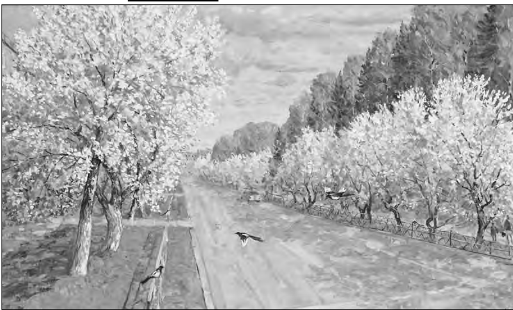
Цветущие яблони, 2012-2013 гг.