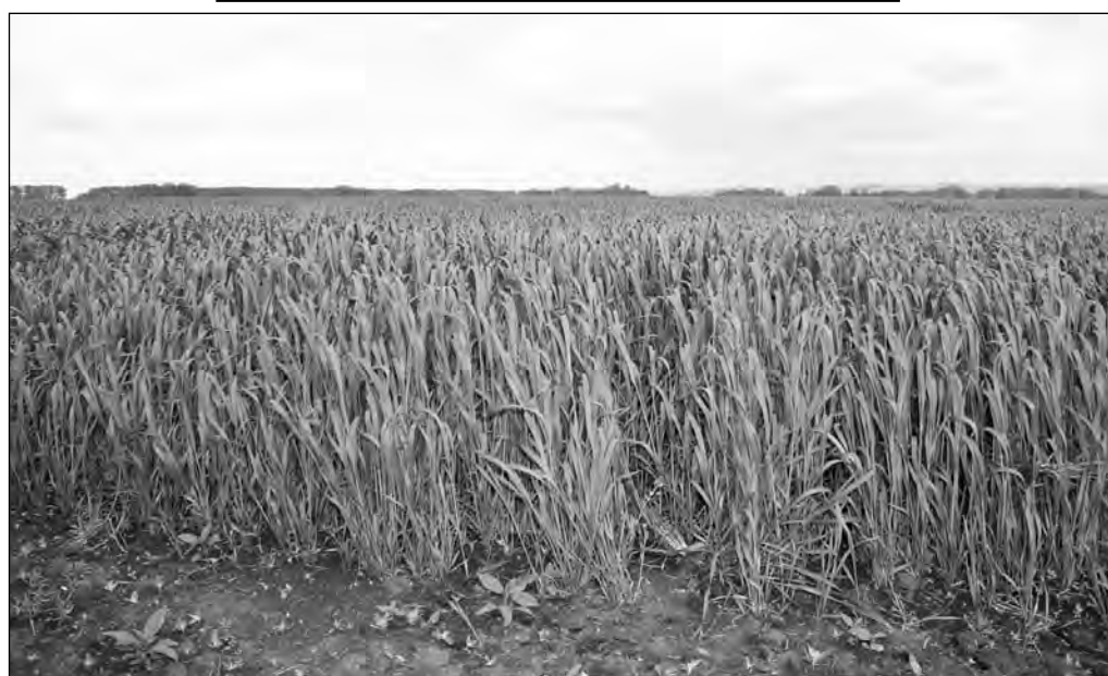
Озимые под урожай 2013 года.