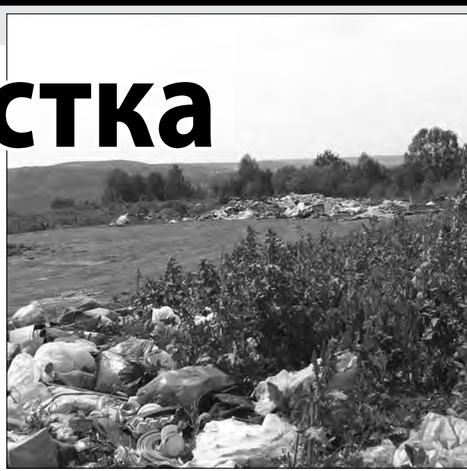
Точечная свалка в Новокузнецком районе, неподалеку от с. Ашмарино. В Кузбассе сегодня 13 полигонов ТБО и 7 санкционированных свалок ТБО.

Комитет охраны окружающей среды и природных ресурсов администрации Новокузнецка утвердил план по выявлению и ликвидации несанкционированных свалок. Одни убирают во время субботников, которые прохо-