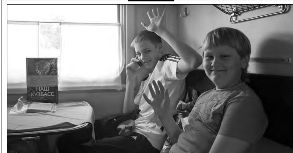
Вчера из Кемерово на двухнедельный отдых в Грецию отправилась третья группа кузбасских ребят. В группе – 280 человек. В группе дети из семей погибших шахтеров и ветеранов боевых действий, отличники учебы, активисты творческих коллективов и объединений, победители областных и всероссийских спортивных соревнований. Поездка в детский центр «Лауринский», расположенный на острове Эвия, организована по инициативе губернатора А. Г. Тулеева.

Прогноз предоставлен Кемеровским гидрометеоцентром.