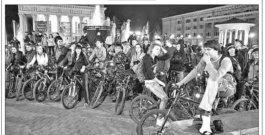
Первая в этом году велоночь прошла в Новокузнецке: любители ночного велопробега собрались на центральной площади.