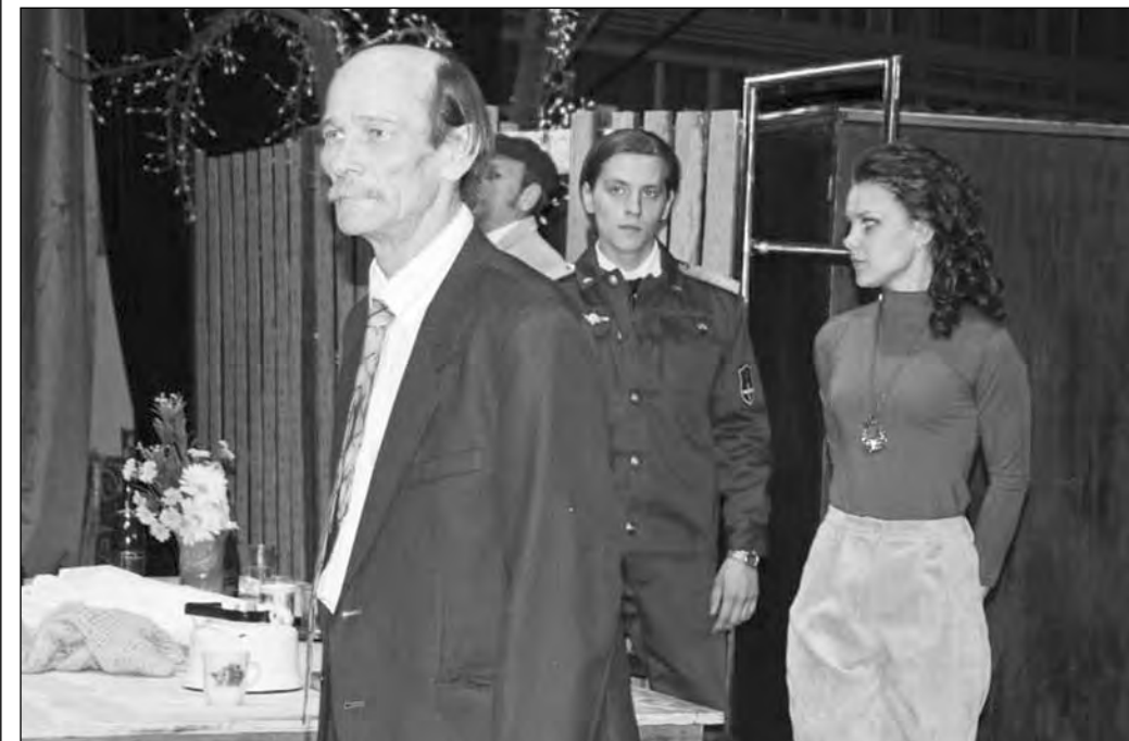
Сцена из спектакля «Старший сын».