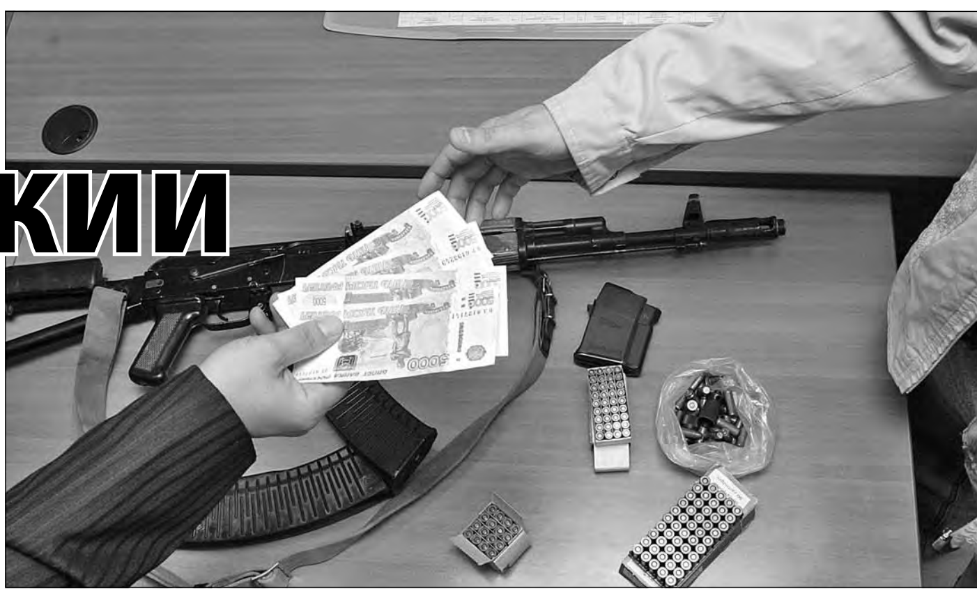
За последние 12 лет кузбассовцы добровольно сдали в полицию около 4000 единиц оружия, получив за это свыше 4 млн. руб.

В воскресенье на 62-й сессии депутаты Кемеровского облсовета приняли закон, который определяет порядок приема оружия у населения и выплаты вознаграждения за него. По мнению разработчиков документа, теперь процедура «оружие — деньги» должна стать более быстрой.