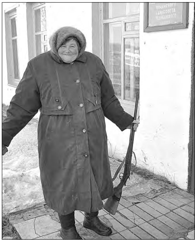
Расценки за оружие, добровольно сданное гражданами в полицию

С начала мая, когда было объявлено о новых расценках за добровольную сдачу оружия, жители Кузбасса принесли в полицию 138 «стволов», 4 гранаты, почти 3 кг взрывчатки, четыре десятка электродетонаторов и более 5500 патронов. Эти цифры почти в полтора раза больше, чем за весь 2012 год, когда полицейские приняли от населения всего 89 единиц оружия.