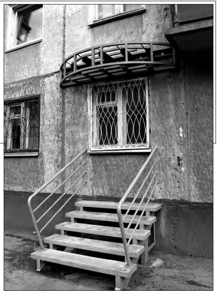
«Дверной косяк».

••• - А как у тебя с химией в институте было? - 300 рублей - зачёт, 500 - экзамен. ••• Иногда меня муж называет сокровищем. После этого я боюсь спать, вдруг закопает! ••• Хочу иметь столько денег, чтобы в них можно было книги свои прятать... ••• - Ничего я не толстая! Мне Саша говорит, что у меня идеальная фигура. ••• - Оля, он математик, для него идеальная фигура - шар.