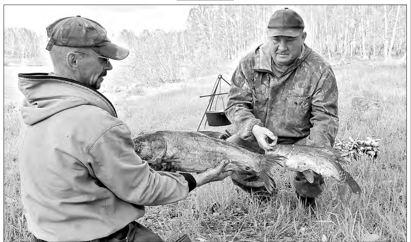
На прудах и реках области начинается рыбалка. Любителей отдыха с удочкой ждет богатый улов.