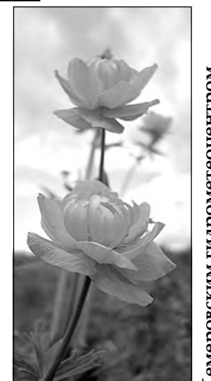
Прогноз предоставлен Кемеровским гидрометеопцентром.

Днем переменная облачность, местами небольшой дождь, ветер неустойчивый слабый. Давление будет слабо расти, влажность существенно не изменится. Общий уровень загрязнения атмосферы ожидается невысокий.