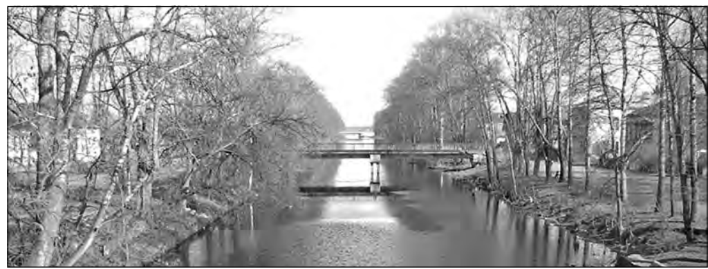
Вышневолоцкая водная система.