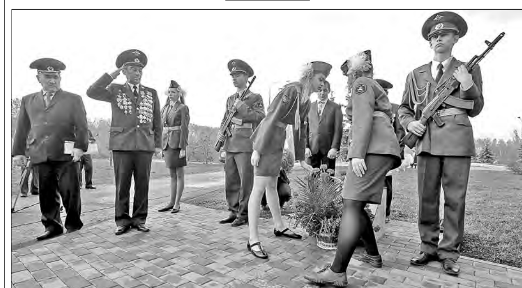
Вскоре в парке Победы им. Г. К. Жукова появится новый памятник воинам-пограничникам. Вчера состоялась торжественная закладка камня в его основание.