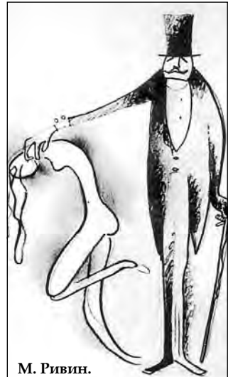
М. Ривин. Наброски персонажей к спектаклю Б. Брехта «Трехгрошовая опера»