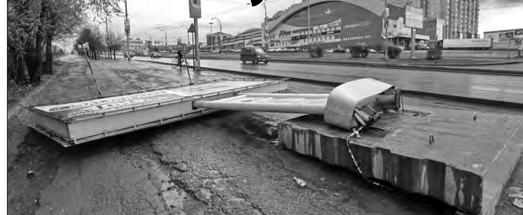
Этот рекламный щит на кемеровском проспекте Ленина у Искитимского моста рухнул 10 мая, едва не придавив проходящую мимо женщину. Уже через три часа конструкция с пешеходной дорожки убрали, однако вопрос о надежности подобных «парусящих» конструкций остался...

В Кузбассе несколько дней бушевала непогода. Ветер дул со скоростью 24-27 м/с - валил деревья, сносил рекламные баннеры, дорожные знаки... «Дополнили мрачную картину дождь, снег, а в некоторых районах - град.