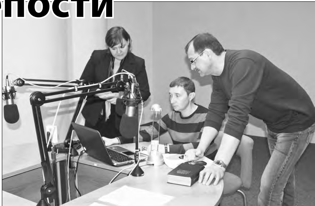
Голосование идет в прямом эфире радио России-Кузбасс.

О том, зачем нужно голосовать за кузбасские объекты в рамках всероссийского проекта «Россия 10», даже если соперники явно сильнее, состоялся разговор, инициированный редакцией газеты «Кузбасс» и радио Кузбасса, вчера в прямом эфире радио России-Кузбасс.