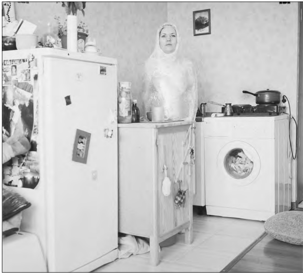
«Гусеница» Василия Мельниченко.

Проект Мельниченко «Гусеницы» - это серия крупноформатных фотографий, героинями которых стали женщины средних лет (от 27 до 45), разнообразных профессий, красавицы и дурнушки. Все они раздеты донага и завернуты в полиэтиленовую пленку, образующую полупрозрачные коконы. Интимные части, впрочем, почти не просвечивают – нынешние вечерние или летние женские одежды гораздо менее целомудренны. Интерьеры подобраны по роду занятий: то гламурная гостиная, то мрачная стирка, то навороженный