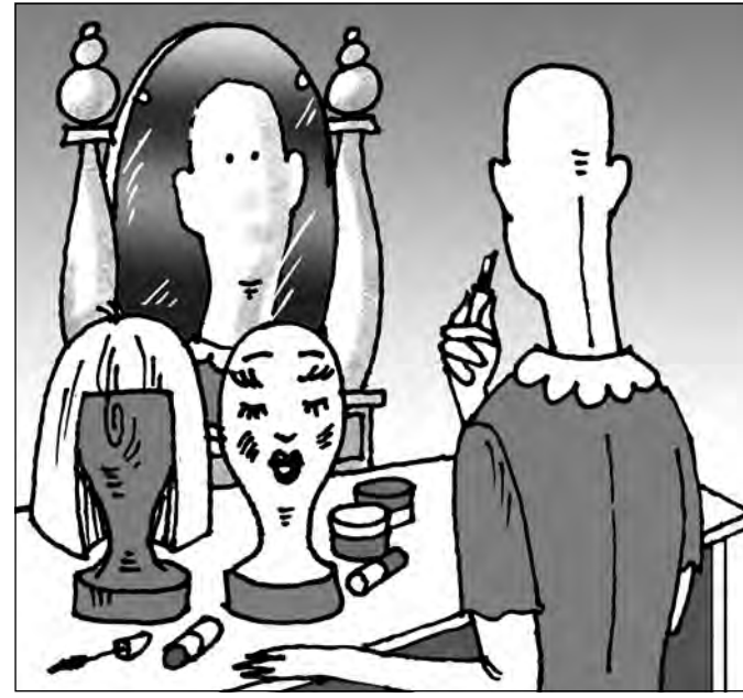
Рис. Андрея Горшково.

Редакция не отвечает за содержание публикуемых объявлений. Время подписания номера в печать по графику 18.00. Сдан в печать 18.00. Объем 2 п.л. Печать offsetная. Тиражи во вторник, среду, пятницу, субботу - 9621, в четверг - 31006. Газета набрана и сверстана на компьютерном комплексе газеты «Кузбасс». Отпечатано в ОАО «Советская Сибирь»: 650630, г. Кемерово, пр. Октябрьский, 28. Заказ № 63.