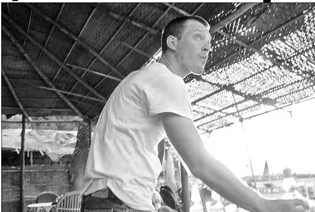
Рассвет. Работа в баре заканчивается.