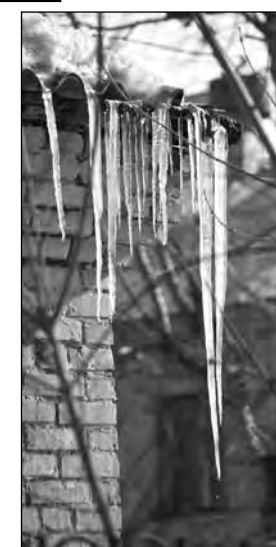
Прогноз предоставлен Кемеровским гидрометеосцентром.

Общий уровень загрязнения атмосферы ожидается невысокий.