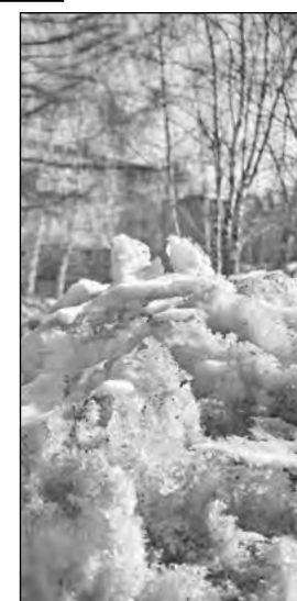
Прогноз предоставлен Кемеровским гидрометеорологическим центром.

Сегодня Днем переменная облачность, местами небольшие осадки, ветер западный умеренный. Давление будет расти, влажность существенно не изменится. Общий уровень загрязнения атмосферы ожидается невысокий.