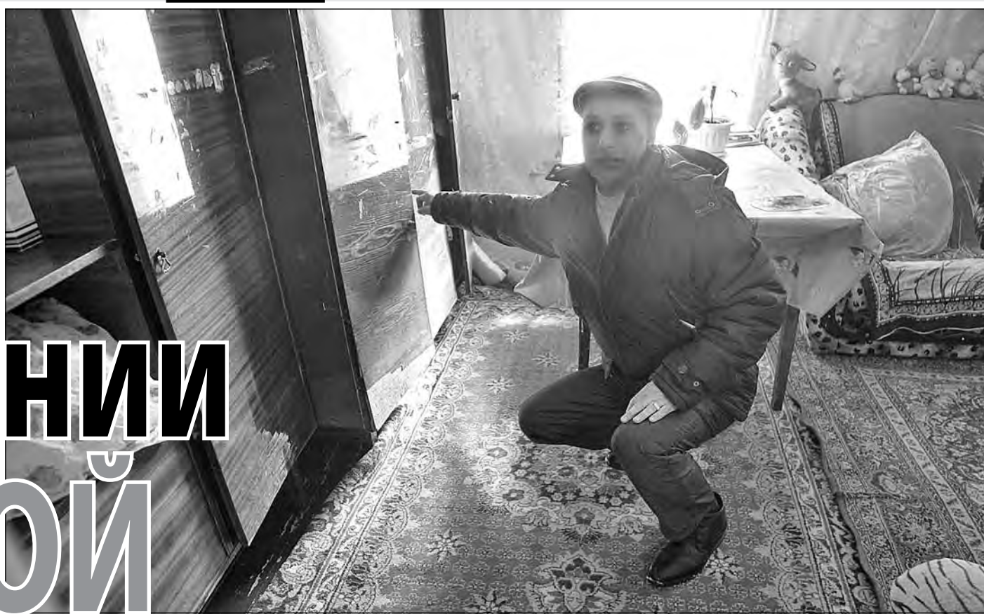
Вода в доме Шалычевых поднималась до этой отметки.

НОВОКУЗНЕЦК: от страховки до молитвы 27 марта прошел очередной штаб по подготовке к паводку. Обсуждали готовность Новилынки. Этот район не попадает в зону возможного затопления, но может принять эвакуируемых из других территорий. Здесь развернуто 10 пунктов временного размещения. Всего же в городе 76 ПВР, больше всего их в Заводском районе – 20. Город практически готов к встрече со стихией. ПИМС провела техосмотр