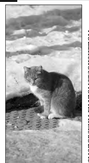
Прогноз предоставлен Кемеровским гидрометцентром.

Сегодня Днем облачно с прояснениями, снег, метель, ветер юго-западный умеренный, порывы до сильного. Давление будет падать, влажность существенно не изменится. Общий уровень загрязнения атмосферы ожидается невысокий.