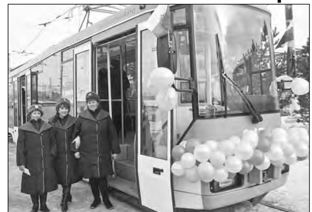
Особенный трамвай начал курсировать по Новокузнецку.

Особенность в том, что его собрали на месте, в муниципальном трамвайном предприятии №1, из старых, но капитально отремонтированных тяговых тележек и нового кузова, изготовленного на белорусском заводе «Белкоммунмаш». Пусконаладочные работы специалистами были проведены совместно.