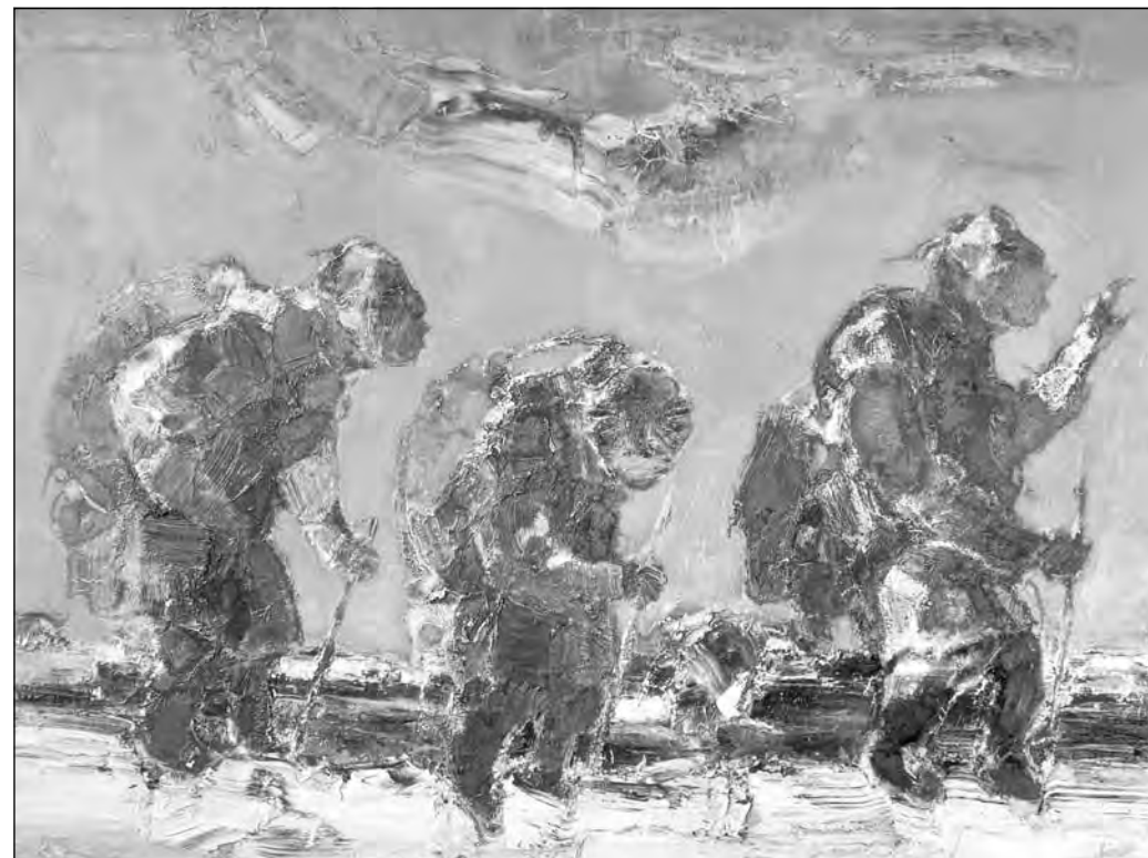
Николай Рыбаков. «Единоверцы с ношей». 2012 г.