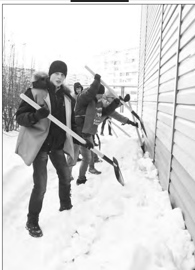
Во всех городах и районах области в эти дни очищают дворы и улицы от снега и наледи. 13 тысяч человек приняли участие в субботнике, который прошел в Кемерове в минувшую пятницу.