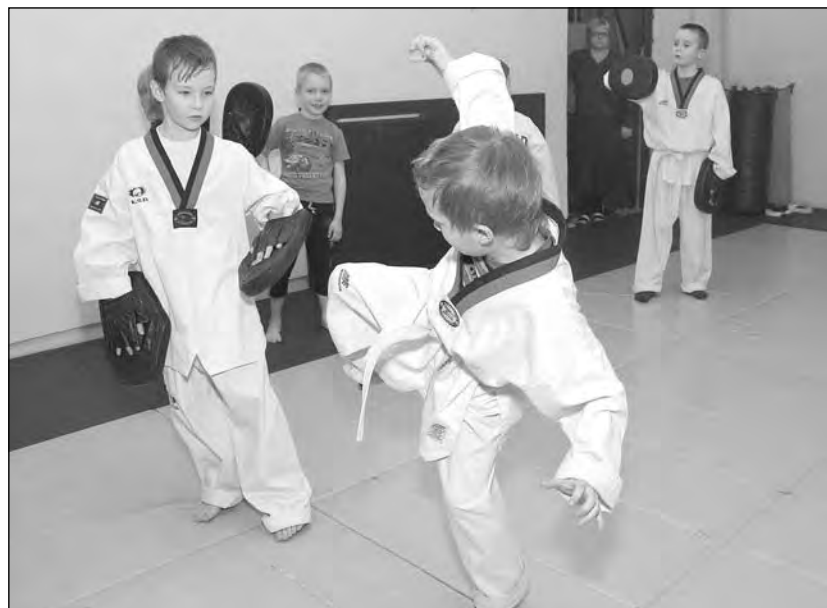
Друзья-гимназисты и дзюдоисты.