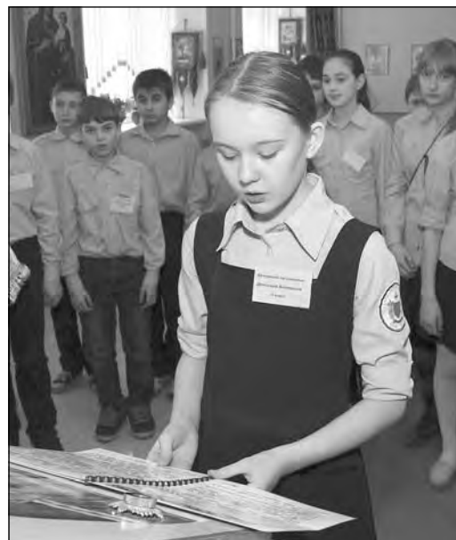
Утро начинается с молитвы.