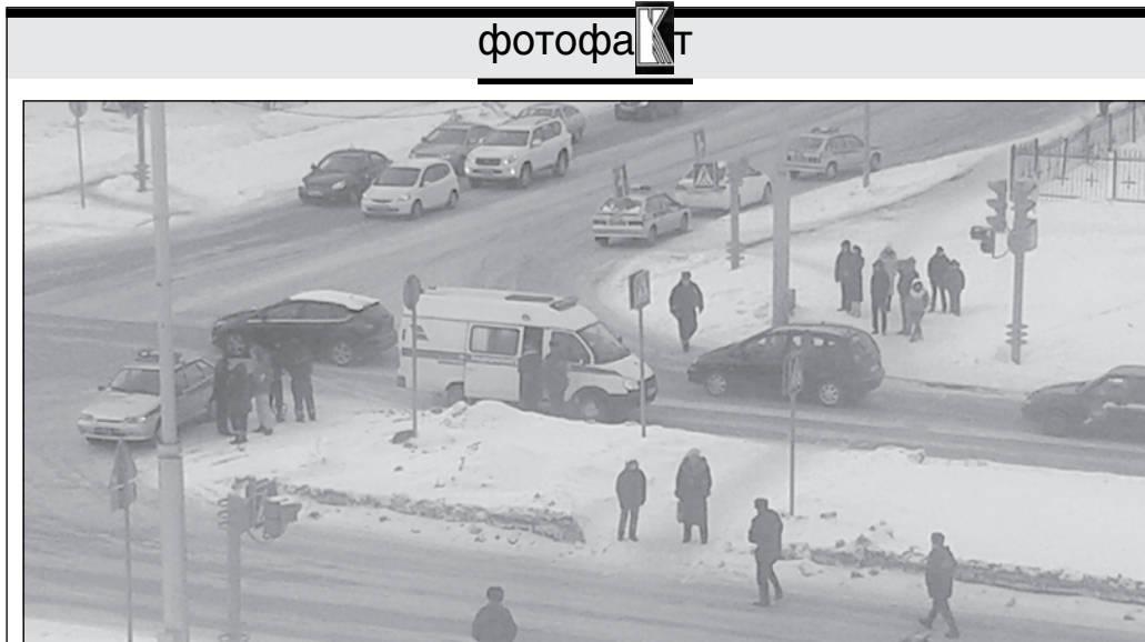
Вчера в областном центре около 16 часов в микрорайоне Южный, на перекрестке улиц Космической и Двужыльного, был сбит школьник. По словам очевидцев, мальчик переходил проезжую часть на регулируемом перекрестке по пешеходному переходу, где его и сбил автомобиль. На место ЧП прибыла «скорая» и четыре экипажа ДПС.