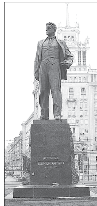
Маяковский в Москве.

1 Монументов работы Кибальникова в Кузбассе нет, хотя он изваял в конце 1970-х бюст Алексея Леонова. Но сам космонавт предпочел бюст работы другого академика, Льва Кербеля; он и был установлен в Кемерово на улице Весенней четвёртой века спустя.