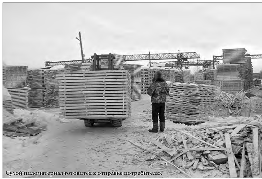
Сухой пиломатериал готовится к отправке потребителю.

– Суловский леспромхоз рубит сук, на котором сидит. Потому что вынуждает лесозаготовителей работать если не в убыток себе, то с нулевым результатом. Зато у ЛПХ, если просчитать экономику, с учетом низкой закупочной цены, просушки и отправки пиломатериала, рентабельность производства составит все 100-150%. Считаю, леспромхозу надо либо повысить цену на нужную ему продукцию, и тогда все начнут везти ему березу, либо создавать собственные бригады, брать в аренду лес и самому заниматься наиболее сложным и трудоемким процессом – лесозаготовкой. Другого выхода нет, иначе можно уйти в тупик. И будущий лесокombинат, который, надеемся, будет дан в эксплуатацию в нашем районе, у ЛПХ тоже должен вызывать опасение. Потому что и он будет работать на лиственной древесине. Чтобы обеспечить себя сырьем, комбинат может взять в аренду необходимое количество лесозаготовительных участков. И перетянет на себя часть поставщиков лиственной древесины. Если он предложит максимально высокую цену, то конкурировать с ним будет трудно. Поэтому леспромхозу уже сегодня надо менять экономическую тактику.