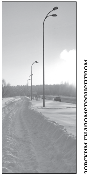
Прогноз предоставлен Кемеровским гидрометеоцентром.

Переменная облачность, без осадков, ветер западный 2-7 м/с, температура ночью -23 – -28°C, днем -10 – -15°C.