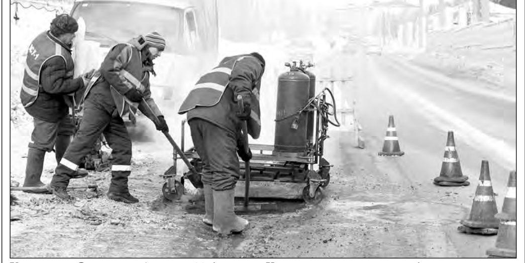
Кемерово, Сосновый бульвар, 28 февраля. Уже началась укладка асфальта.