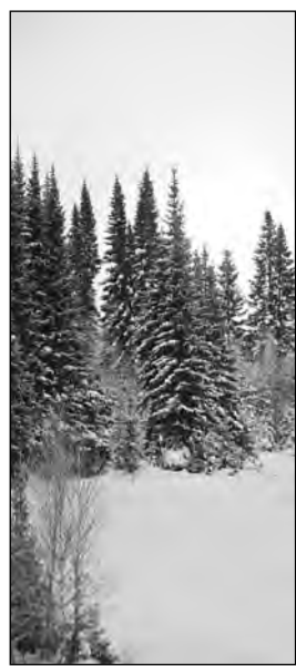
Прогноз предоставлен Кемеровским гидрометеорологическим центром.

Общий уровень загрязнения атмосферы ожидается невысокий.