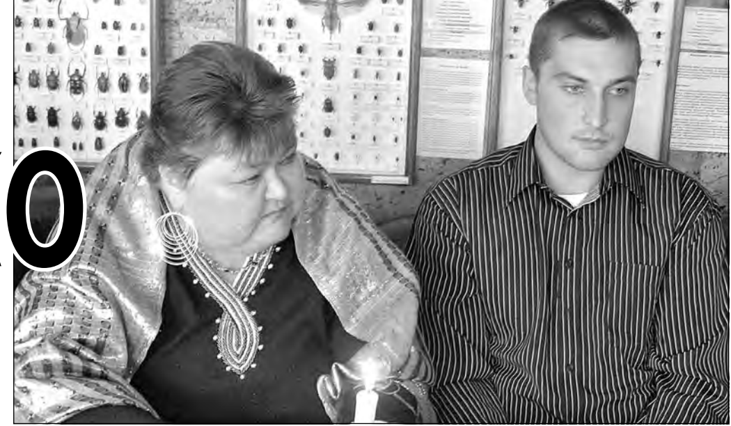
Головины на заседании клуба любителей поэзии в музее Чивилихина.

В общем, технология творчества самая непредсказуемая. Вот типичный пример: «Ужин нужно готовить, а я? то картошку чищу, то бросаю всё и бегу записывать откуда-то идущие стихи - одно за другим». Так и родилось ироническое стихотворение «Муза и картошка» («Жизнь