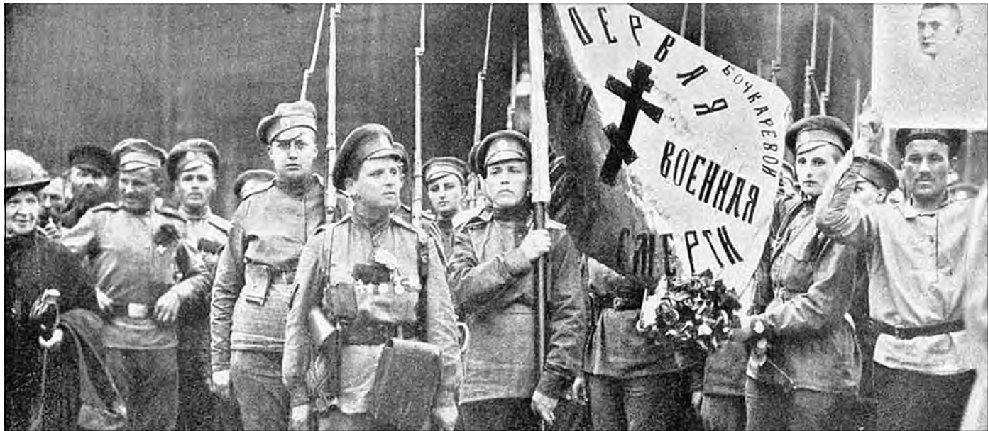
Первый женский батальон смерти М.Л. Бочкаревой.