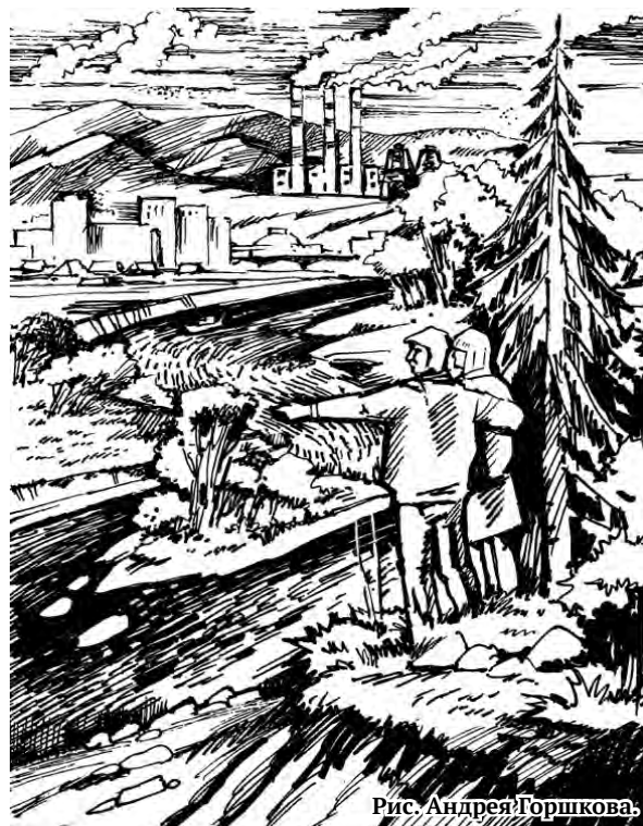
Рис. Андрей Горшкова.