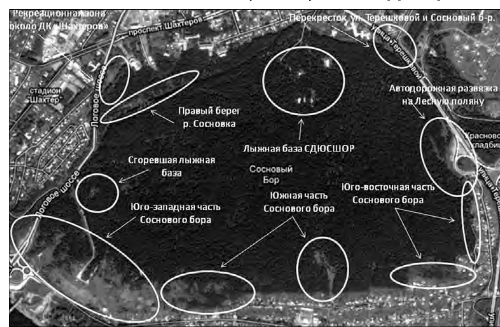
Схема расширения Соснового бора за счет посадки сосновых саженцев на прилегающей свободной территории