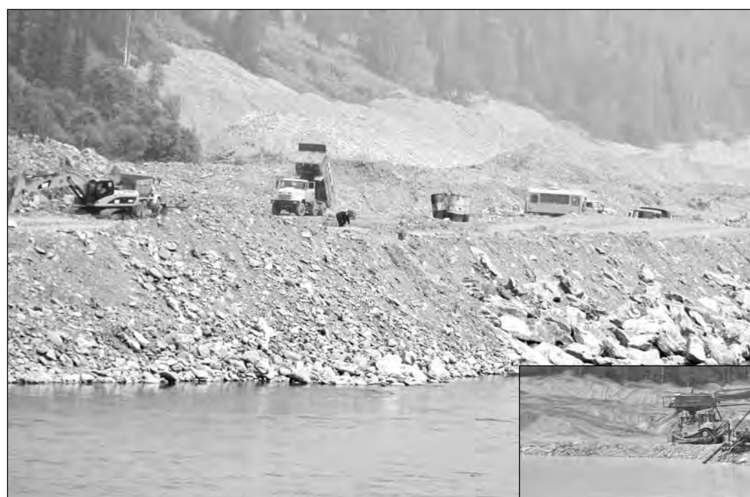
Такова Уса в верховье.

Берега этой реки начали «осваиваться» с XVIII века, когда на притоках Усы были обнаружены богатые месторождения россыпного и рудного золота. Там до сих пор сохранились старинные шахты и шурфы, рукотворные горы грунта и щебня, до сих пор находят кандалы, орудия добычи, керосиновые лампы, масляные фонари и другие предметы. А начиная с официального открытия золотой россыпи на реке Кедровка в 1845 году карта верховьев Усы покрылась густой сетью приисков. Подземным и открытым способом драгоценный металл добывали по долинам рек Базан, Яковлева, Собака, Березовая, Пономаревка, Мурты, Верхний Кибрас, ключа Климковский. Тем не менее Уса десятилетиями сохраняла свою первозданность. Уже после Великой Отечественной войны по этой реке из Сталинска (Новокузнецка) свободно проходили большие лодки и самодельные баржи до поселков в среднем течении.