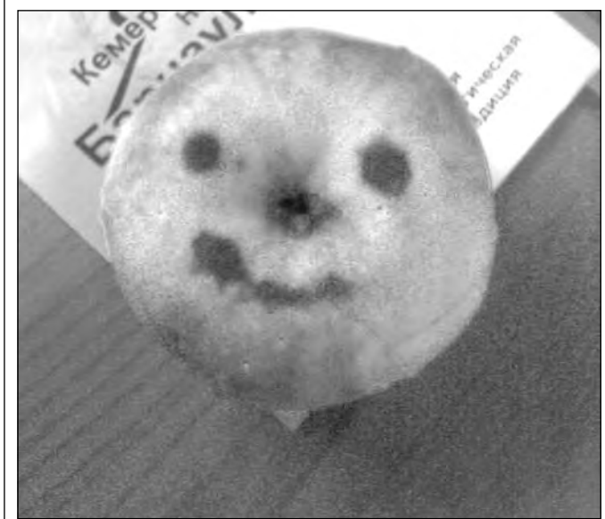
От улыбки станет всем вкусней.