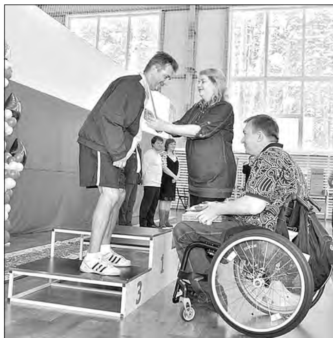
С.А. Поддубный награждает победителей турнира.