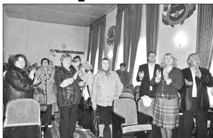
Самодельные концерты для ветеранов - настоящий праздник.

Такую задачу не решить, если не будет доброго настроения и уверенности у людей, которые обеспечивают транспортную работу изо дня в день. Профессионалы, которым кемеровчане доверяют свою жизнь и здоровье, должны быть выдержанными, воспитанными, культурными.