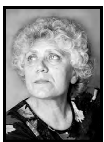
Партизанской», «Кабы на ветры да не морозы».