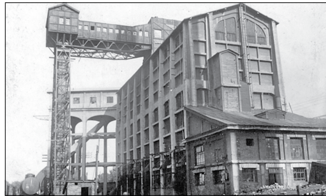
Железнодорожный вокзал станции Кемерово, здание угледобывания на территории коксохимзавода.

ков: на каждом из них появилось несколько крупных шахт. Началось строительство на Прокопьевском, Киселевском, Шестаковском рудниках.