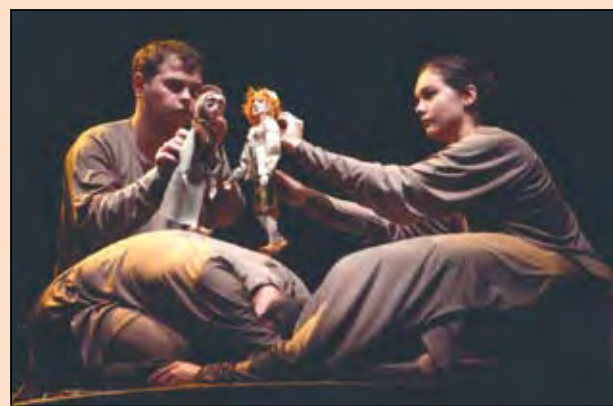
Спектакль «Пер Гюнт» Кемеровского областного театра кукол не завоевал призов на фестивале в Челябинске, но зато покорила сердца самых искушенных ценителей...

«Мы лепили, мы лепили, наши пальчики занули...» Зато при этом ребенок получил кучу полезных навыков и положительных эмоций!