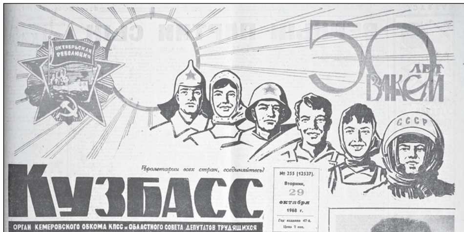
Так газета «Кузбасс» за 29 октября 1968 года отметила полувековой юбилей комсомола.