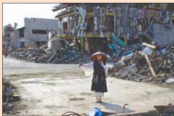
«Не надо искать ни чернухи, ни белухи, важно задокументировать событие». Это жесткое, но честное правило агентства АП и фотокара Сергея Пономарева. Поражаемся и учимся...