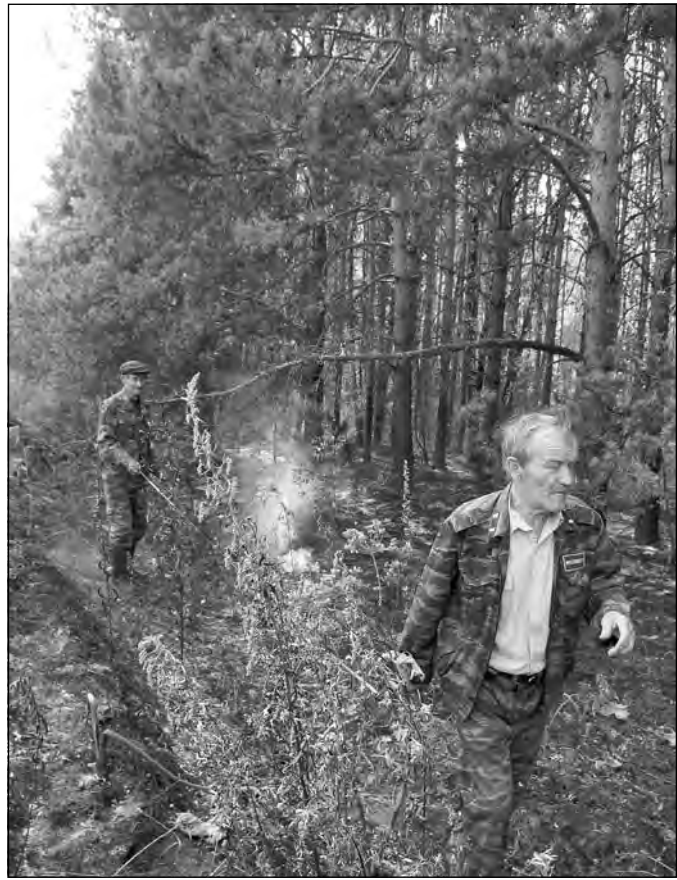
(Окончание. Начало на 1-й стр.)

В случае сохранения высокого класса пожарной опасности по условиям погоды департаментом будут приняты дополнительные меры, в том числе постановлением губернатора Кемеровской области будет введен специальный режим, ограничивающий пребывание граждан в лесах и въезд в них транспортных средств.