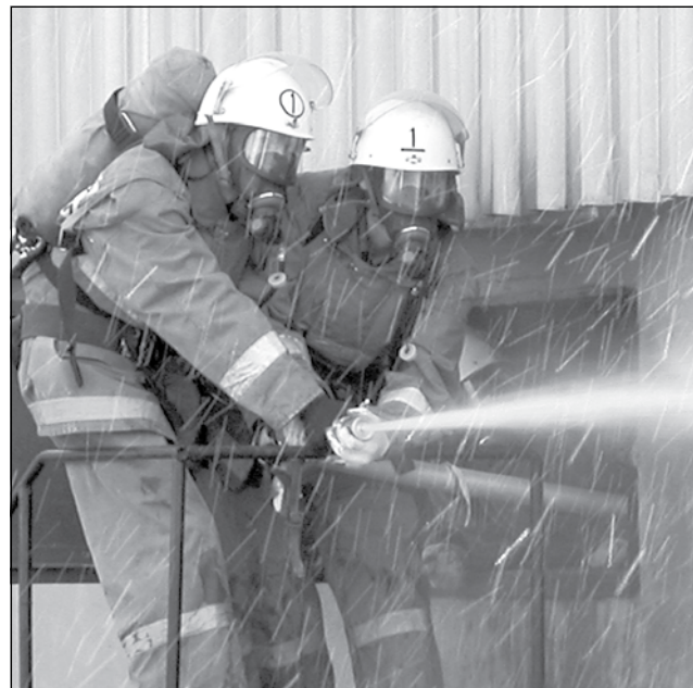
Рабочие будни пожарных.