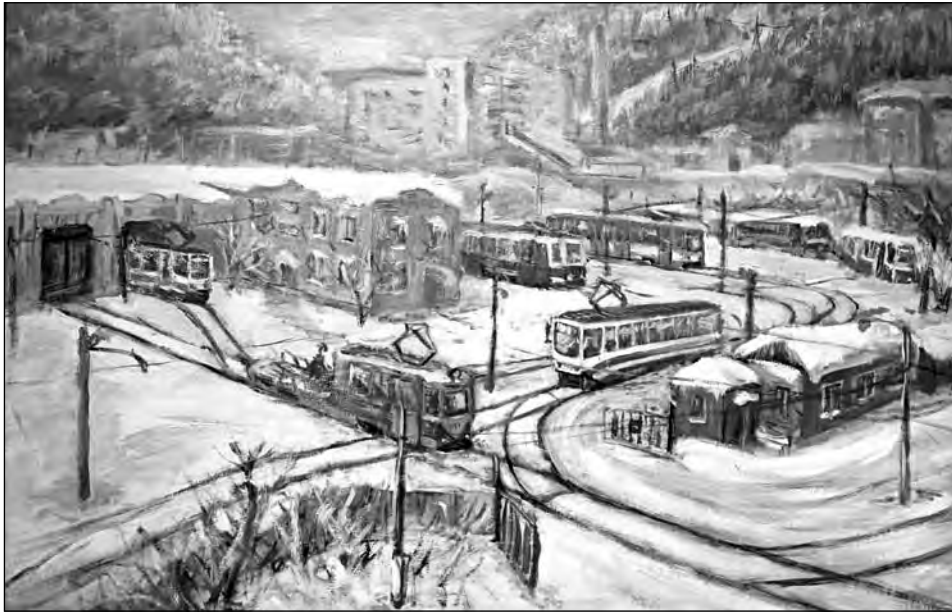
Илья Кожевников. Из серии «Трамвайная республика».