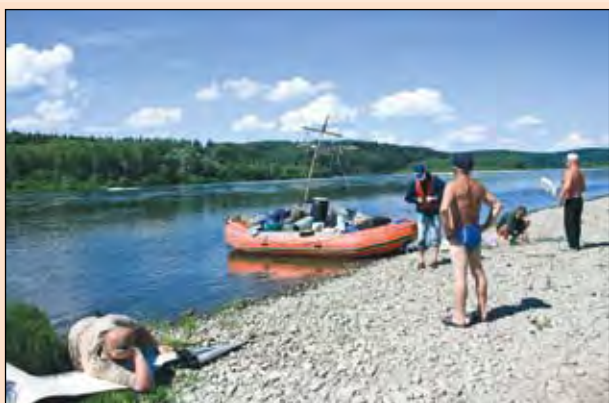
Завершаем публикацию путевых заметок наших спецкоров, которым пришлось (посчастливилось!) целую неделю плыть на рафте по Томи.