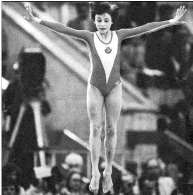
Самая миниатюрная, но бесстрашная.