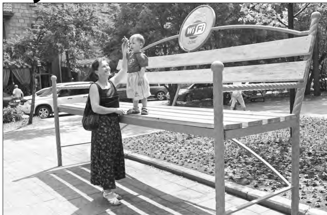
Двухметровая скамейка на улице Весенней в Кемерове.

Березовские специалисты по озеленению давно освоили технологию вертикального озеленения. Уже есть 56 различных форм: цветочные дельфины, тюльпаны, олени и шары. Этим летом к ним при-