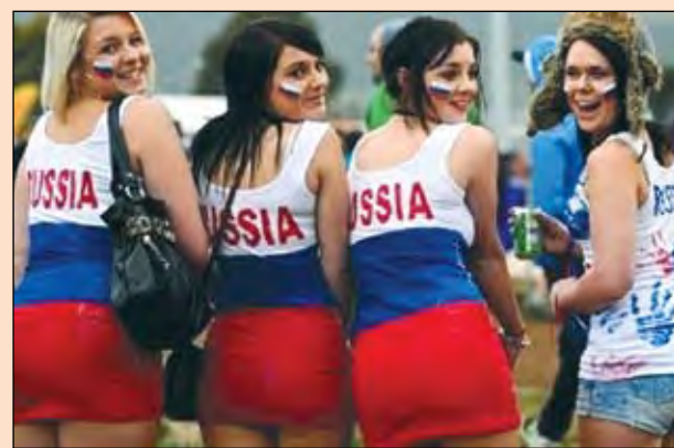
Какие у наших болельщиков виды на ЕВРО-2012? О кого может споткнуться «русская машина» Дика Адвоката?

Исследование родительского фиаско, существование людей в российской провинции, одиночество стареющего человека – темы книги, которые попали сегодня в поле зрения нашего рецензента.