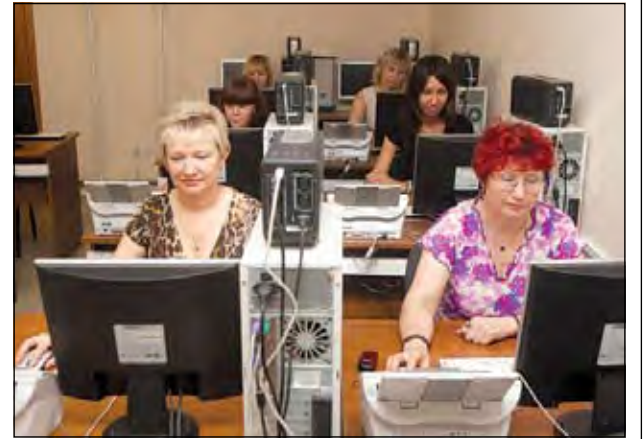
Идет процесс верификации.

— Верификация — это проверка качества распознавания, которая осуществляется путем сравнения на экране монитора символов, внесенных в машиночитаемую форму ППЭ, на бланк ЕГЭ или в протокол проверки с теми же символами, полученными