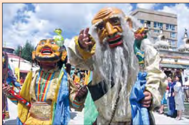
Если вам надоела оседлая жизнь и вы хотите накопаться как следует, неделями не встречая людей, - приезжайте в Монголию. Здесь каждый русский найдет для себя много знакомого...