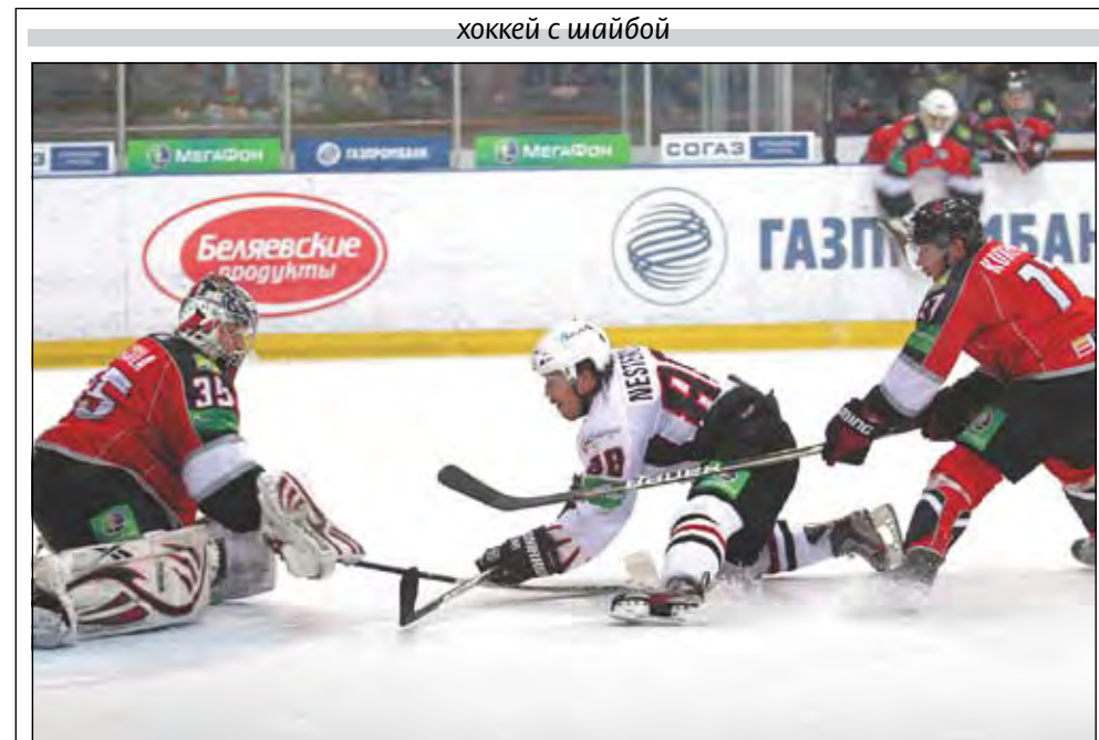
хоккей с шайбой