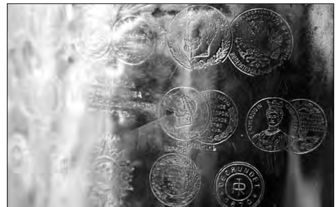
Самоварные знаки «отличия».

Галина БАБАНКОВА. Белово.