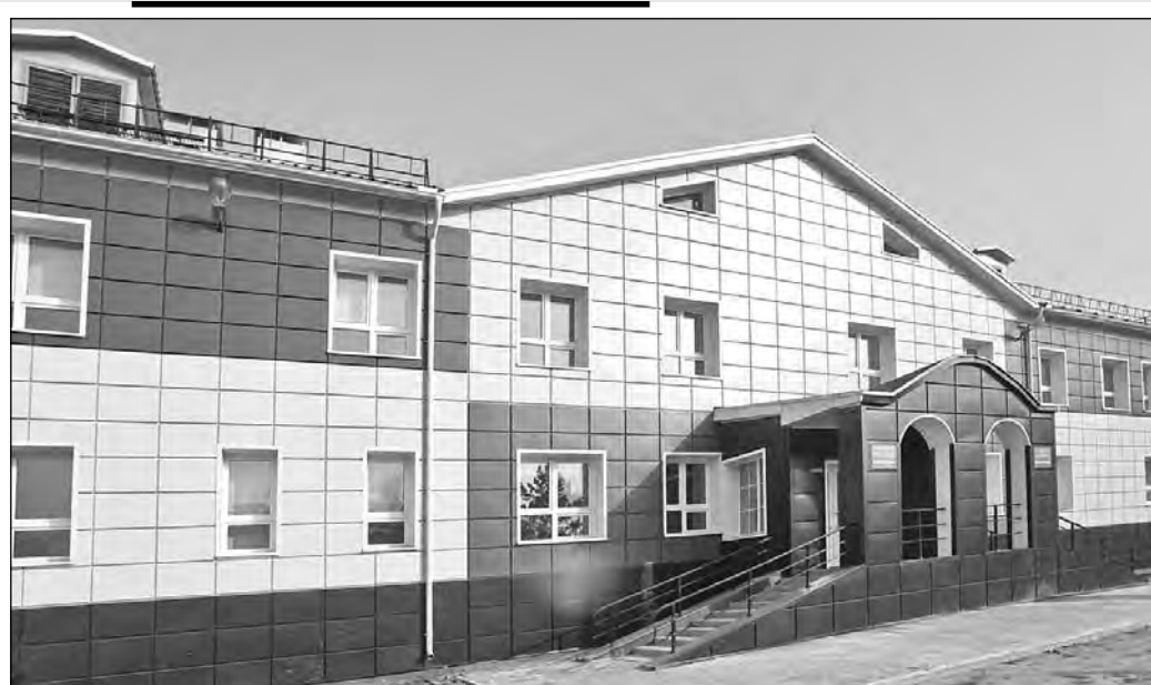
Здесь уже сами стены лечат.

Пока палаты заполнены не полностью. Хотя, с другой стороны, это ведь и ра-