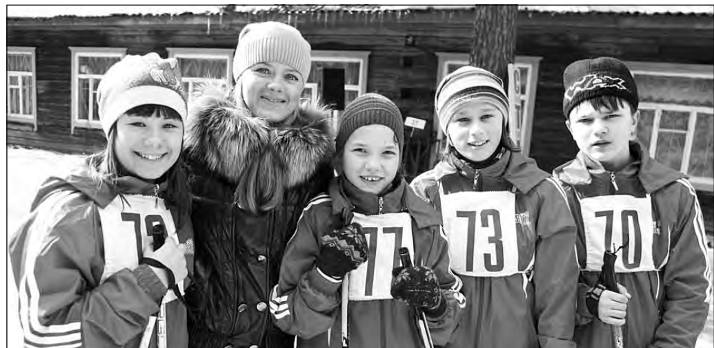
Команда детского дома №1.