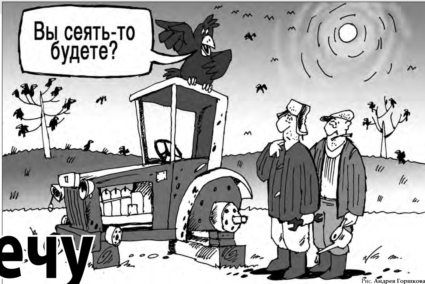
Рис. Андрея Горшкова.

Дело к посевной, пора брать кредиты и закупать семена, удобрения, химикаты, «горючку» да запчастки. Именно по такой схеме работает большинство агропредприятий и фермеров. Считается, что на проведение весенне-посевной кампании в Кузбассе требуется немногим меньше 700 миллионов рублей кредитных средств. Главный кредитор кузбасского агропрома — Кемеровский филиал ОАО «Россельхозбанк». Именно через него в последние годы кредитовался кузбасский агропромышленный комплекс, доля которого в кредитном портфеле банка составляет до 80 процентов. Но из районов сообщают: нынче как никогда сложно взять кредит на посевную. «Кузбасс» традиционно взялся за проверку и вот что услышал.