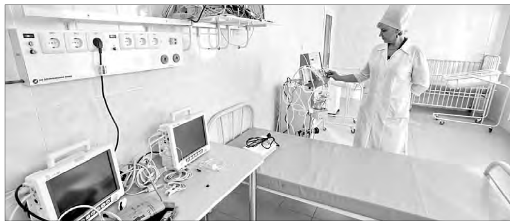
Все по лучшим медицинским стандартам.

дует. Больница есть больница. Здоровые сюда не ложатся. Вот эта молодая мамочка с сыночком понимает, что в стационаре лечение, конечно, лучше, чем дома. Хотя дома у женщин всегда много работы. Но сейчас они думают только о детях. Вместе с ними об этом думают и медики.