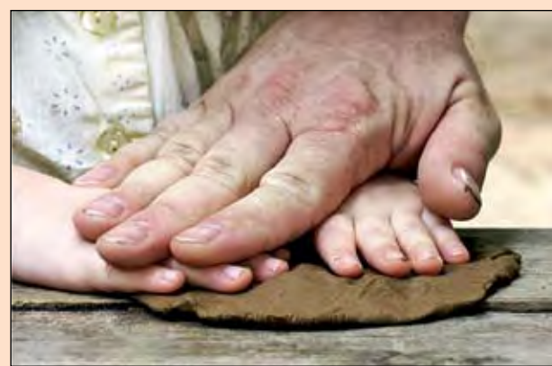
Заняться в свободное время лепкой вместе со своими детьми - это не только правильно, но и приятно, и увлекательно, и познавательно, и полезно.