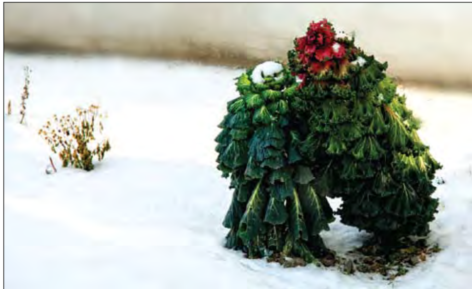
В саду родились елочки...