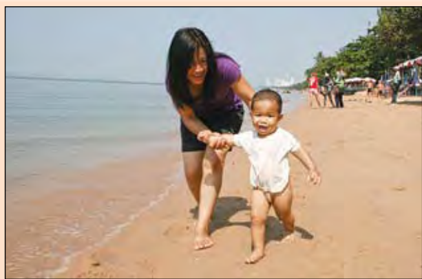
Редколлегия планировала на эту страницу «путевые заметки» про Таиланд, а у автора получился, по сути, лирический рассказ про нас всех. И это хорошо.