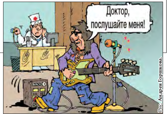
Рис. Андрея Горшкова.